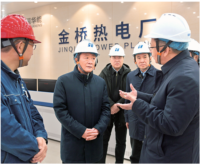
11月9日,自治区党委书记孙绍骋在呼和浩特市华能金桥热电厂认真听取企业运营情况汇报。

本报11月9日讯 (记者 李晗) 加快新能源建设,是孙绍骋十分关注、反复强调的重点工作。11月5日至9日,他先后深入乌兰察布市、呼和浩特市调研新能源发展情况,并主持召开加快新能源发展推进国家重要能源和战略资源基地建设座谈会。