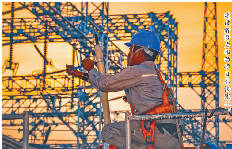
建设者努力推动项目尽快完工。