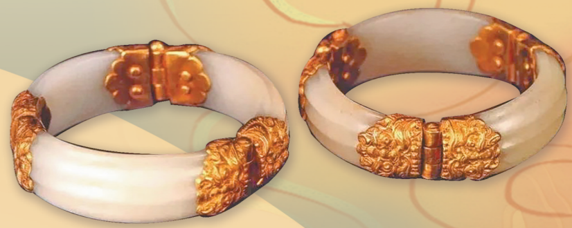
白玉臂环 金玉结合

红山文化玉器造型上最突出的特点是讲究神似，以熟练的线条勾勒和精湛的琢磨技艺，将动物形象表现得活灵活现，极具古朴苍劲之神韵。红山文化玉器多通体光素无纹，动物形象注重整体的形似和关键部位的神似。用料考究、做工精美、纹饰天然、造型繁多的红山玉器，对中国玉器源头的认识和研究产生了极其重要的影响。