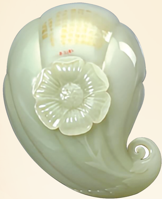
青白玉诗洗 皇家玉雕