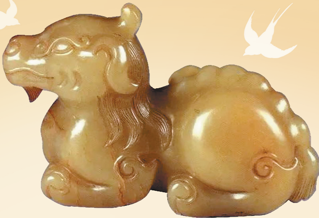
黄玉独角卧兽 惊艳时光

文中诗洗成器于乾隆三十九年(1774年)。整个器形华贵大方，青白玉质，匀净无瑕，细润透光，是乾隆时期宫廷造办处玉器中的珍品。