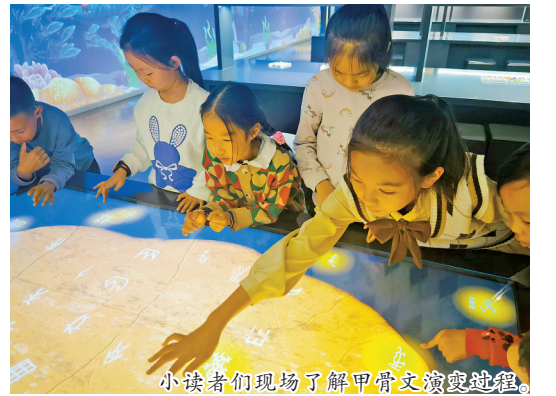
小读者们现场了解甲骨文演变的趣闻。