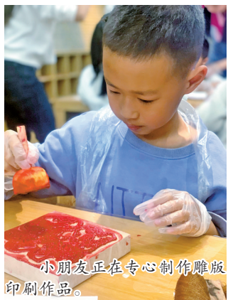
小朋友正在专心制作雕版印刷作品。

这样的活动不仅为小读者们搭建了一个集社交、独立、学习于一体的多元化平台,更通过趣味互动游戏让孩子们感受到中华优秀传统文化的博大精深和无穷魅力,进一步传承汉字文化。