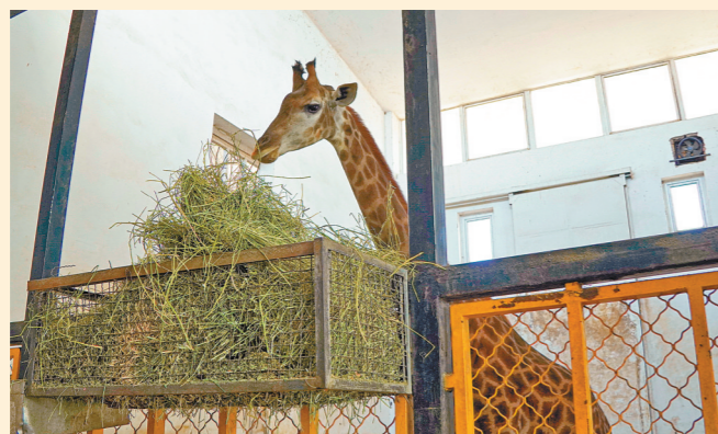
长颈鹿正在享用新鲜草料。