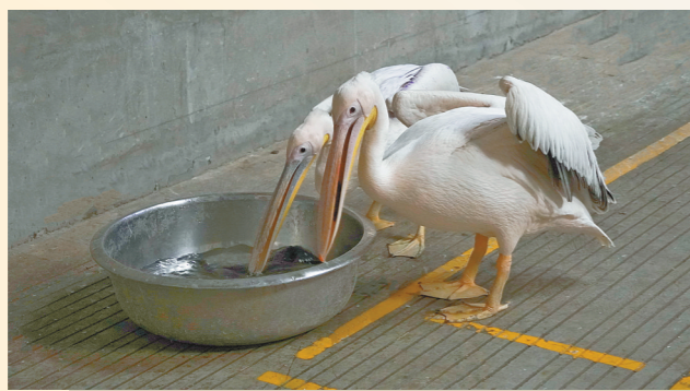
鹤鹑正在享用鲜鱼。