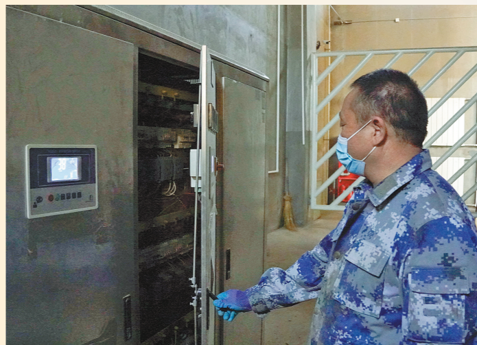
工作人员对供暖设备进行日常检查。

“目前大青山野生动物园共有77种、792只动物,我们希望通过充分的保障措施和精心的照料,让生活在这里的动物们度过一个温暖舒适的冬天。”佛宁说。