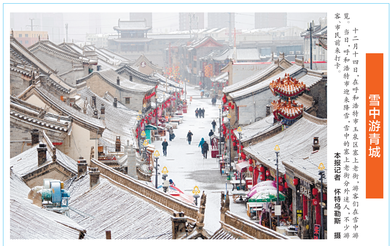
十二月十四日,在呼和浩特特市玉泉区塞上老街,游客们在雪中游览。当日,呼和浩特特市迎来降雪,雪中的塞上老街分外迷人,不少游客市民前来打卡。本报记者 怀特乌勒斯 摄

主线,将贯彻主线和履行职责有机统一起来,有效融入政协履职各项工作中。要明确具体贯彻落实的思路、举措和工作要求,认真谋划协商计划、视察考察、界别活动,增强凝聚共识的针对性和导向性,充分发挥委员主体作用,在助力全方位建设模范自治区中体现政协担当作为。