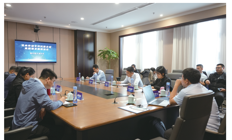
专家与上市后备企业一对一交流。