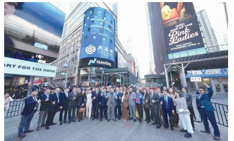
内蒙古燕谷坊在纳斯达克上市。

日,自治区2023年第二场政企沟通圆桌会——拟上市民营企业专场座谈会召开。会后,自治区地方金融管理局围绕拟上市企业逐一建立问题清单,重点推进解决。为推动企业上市工作,自治区地方金融管理局联合证监局、证券交易所相关负责人赴12个盟市调研,逐一推动指导企业上市进程。自治区地方金融管理局还会同网信办、证监局建立拟上市企业网络舆情会商研判处置机制。7月11日,自治区地方金融管理局联合证监局举办拟上市重点企业高管培训班,邀请网信办就“打击网络水军、舆情敲诈、行业内鬼和数据黑企”进行政策解读,邀请公安厅就“打击网络水军、舆情敲诈、行业内鬼和数据黑企”进行专项政策解读。 顶层设计指引,交流合作推进。今年,自治区党政代表团考察访问深交所,自治区政府先后与北交所、深交所签署战略合作协议。7月11日,自治区地方金融管理局、证监局联合上海证券交易所、深圳证券交易所、北京证券交易所、深圳证券交易所在呼和浩特共同举办内蒙古资本市场服务月活动。自治区地方金融管理局有关负责人走访服务全区12个盟市49家重点拟上市企业,实地指导解决企业上市障碍,助推企业上市进程。为加强资本市场人才交流,该局还先后组织包头、乌海、阿拉善、赤峰、呼和浩特、呼伦贝尔、通辽、乌兰察布金融办8名干部在沪深北证券交易所跟岗学习。 “下一步,2家企业准备向沪深交易所申报上市申请,4家企业准备申报北交所上市申请。全区18家企业进入上市辅导备案,呼伦贝尔市、兴安盟实现上市辅导企业零的突破,上市辅导备案企业实现历年最多;正在开展千户企业上市培训、百户企业入库培育工作,‘培育一批、改制一批、辅导一批、申报一批、上市一批’的企业上市梯次格局不断深化。”自治区地方金融管理局有关负责人介绍。