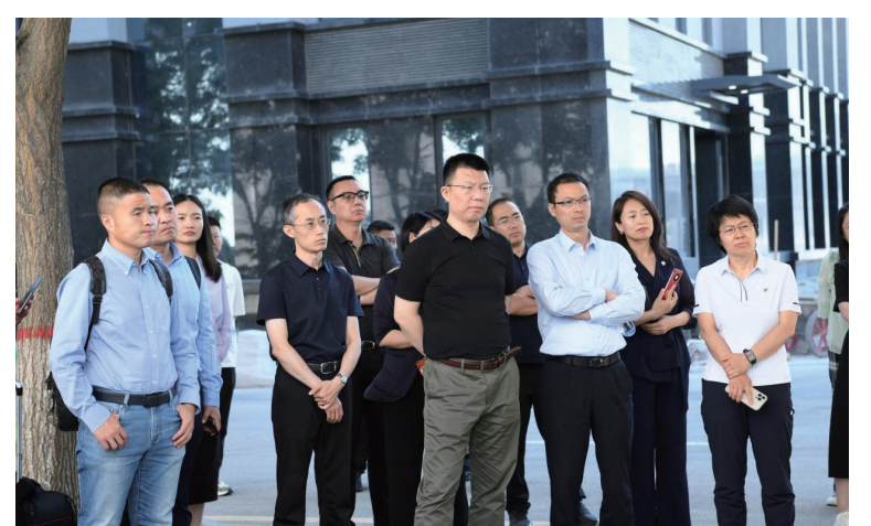
上交所、北交所专家深入上市后备企业调研。