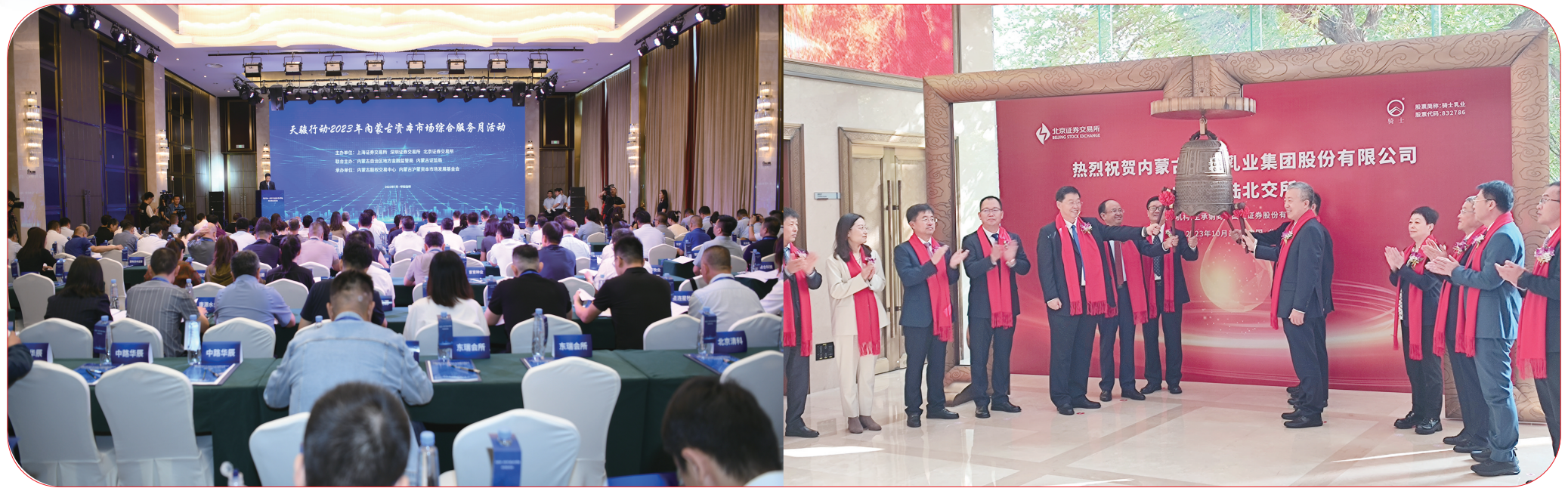
12月2日,内蒙古资本市场综合服务月活动正式启动。