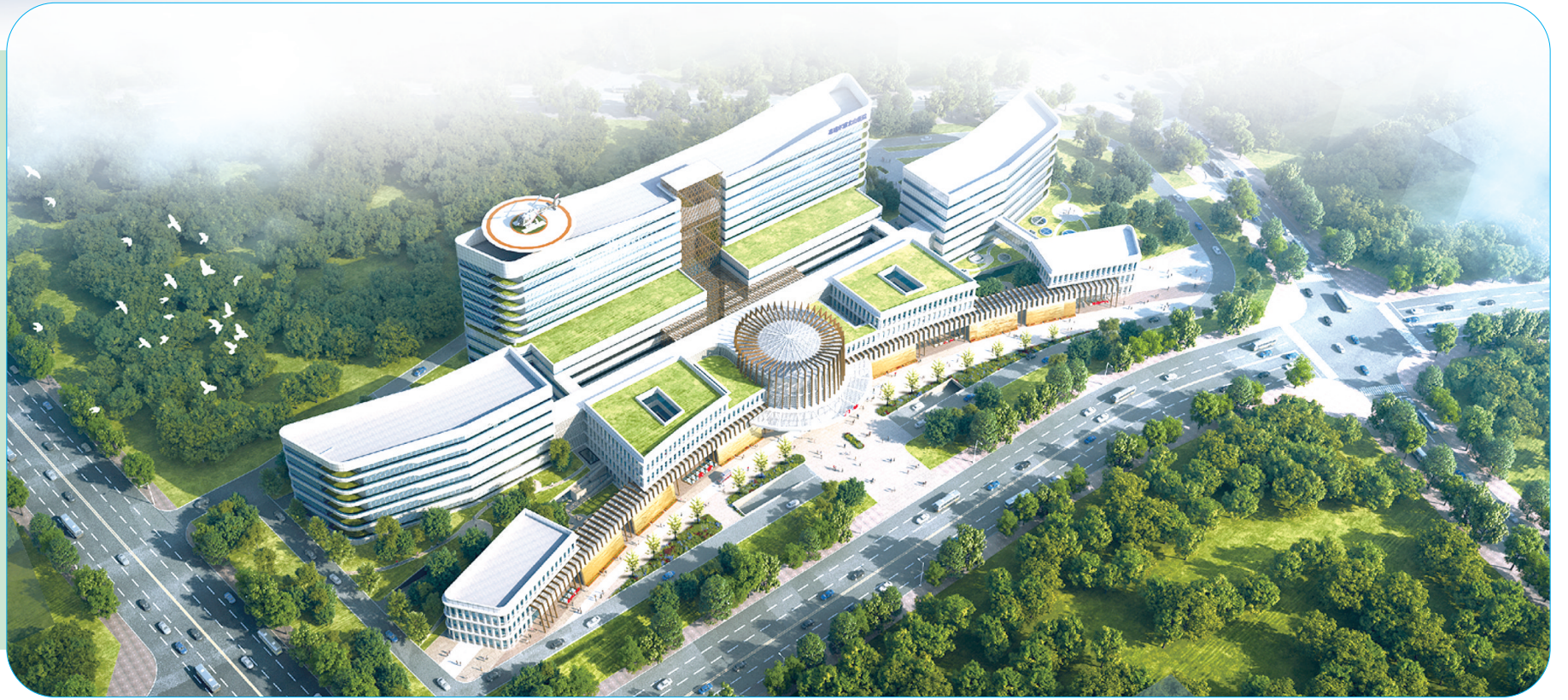
准格尔旗新建的北山综合医院效果图。

惟创新者进,惟创新者强,惟创新者胜。从率先在全区启动公立医院改革,到成为国家、自治区公立医院综合改革示范旗;从成为全国首批紧密型医共体试点旗县,到“千县工程”+紧密型医共体建设落地生根……一个个成功发展的先例和全国健康促进旗、全国卫生县城创建成果的持续巩固,让准格尔旗始终保持着推动卫生健康事业高质量发展的强大动力。准格尔旗始终把深入贯彻党的二十大精神,和习近平总书记对内蒙古重要讲话重要指示批示精神作为根本遵循和行动指南,紧紧围绕高质量完成“五大任务”和全方位建设模范自治区两件大事,以高度的政治站位,全面落实中央、自治区、鄂尔多斯市的相关重大决策部署,卫生健康事业高质量发展迈向新征程。2022年以来,准格尔旗卫健系统在自治区、鄂尔多斯市卫健委的关心指导下,完整、准确、全面贯彻新发展理念,科学谋划、精准发力,提能力、重预防、降负担、增活力,整体医疗服务能力持续增强,医药卫生改革不断深化,“健康准格尔”建设向纵深推进;2022年度,在全市卫健系统目标任务考核中荣膺第一。一系列重大变化和重要成果,得益于准格尔旗在中国式现代化建设中的创新和实践,得益于构建新发展格局的新作为。