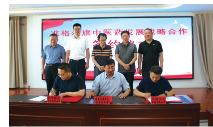
准格尔旗中医药发展战略合作签约仪式。

项目赋能开新局,暖城之域万象新。随着财政支持力度的不断加大,一批批基层卫生院建设项目相继落地,一个个重点工程加速布局,医疗卫生基础设施建设托起百姓有好地方看病的希望。准格尔旗医疗卫生健康事业绿色发展、高质量发展态势已成、其时已至、其兴可待。