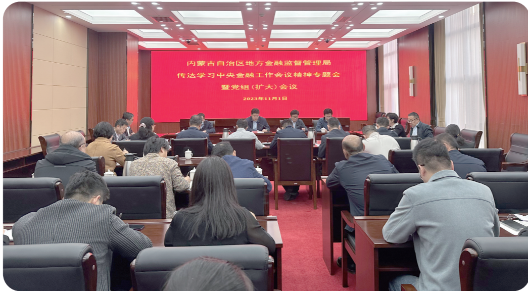
内蒙古自治区地方金融监督管理局传达学习中央金融工作会议精神专题会暨党组(扩大)会议现场。

金融是国民经济的血脉，是国家核心竞争力的重要组成部分，金融活，经济活；金融稳，经济稳。年初以来，自治区地方金融监督管理局以习近平新时代中国特色社会主义思想为指导，全面贯彻党的二十大精神，以铸牢中华民族共同体意识为主线，深入学习贯彻2023年中央金融工作会议精神，坚持稳字当头、稳中求进，以高站位、快节奏、创实效的饱满状态感恩奋进，金融服务实体经济提质增效，有力支持了办好两件大事，为自治区闯新路、进中游和经济高质量发展贡献金融力量。