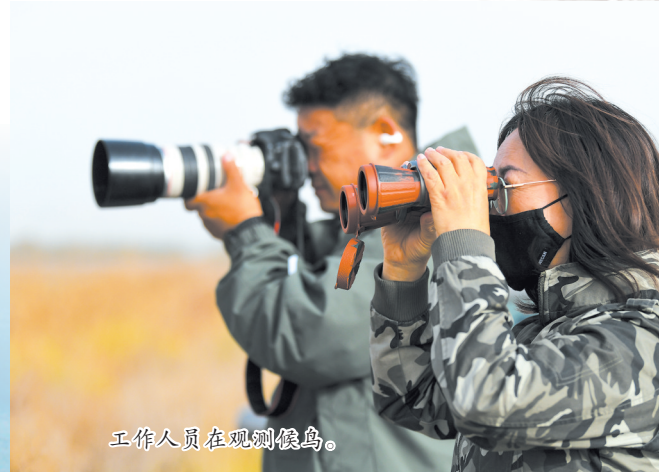
工作人员在观测候鸟。

总策划:王登华 总监制:刘婧 执行监制:吉莉 报道团队:孙一帆 于涛 白雪 孟和朝鲁