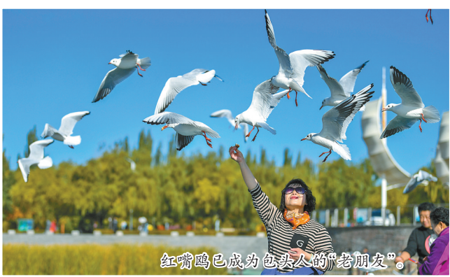
红嘴鸥已成为包头人的“老朋友”。