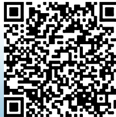
更多精彩,扫描二维码

包头市位于黄河“几字弯”顶端,黄河流经全市220公里,是黄河上中游分界的关键地区,沿黄重要生态功能区。奔涌向前的黄河不仅是包头市工农业发展、人民生活用水的重要来源,也造就了沿岸独特的优美绿色生态环境。