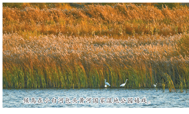
候鸟在小清河包头黄河国家湿地公园嬉戏。

当清晨的第一缕阳光洒向包头市南海子湿地自然保护区,一声鸟鸣打破了沉寂整夜的静谧,随着一只鸟儿起飞,巨大的“鸟浪”腾空而起,鸟翅扑起的声音响彻行云。市区的鹿城人早已习惯,在清晨被“百啾千声”的鸟鸣唤醒。