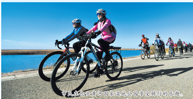
市民在包头黄河国家湿地公园享受骑行的乐趣。