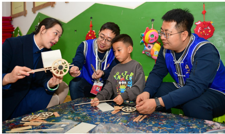
志愿者和工作人员带小朋友互动体验“勒勒车”手工制作项目。