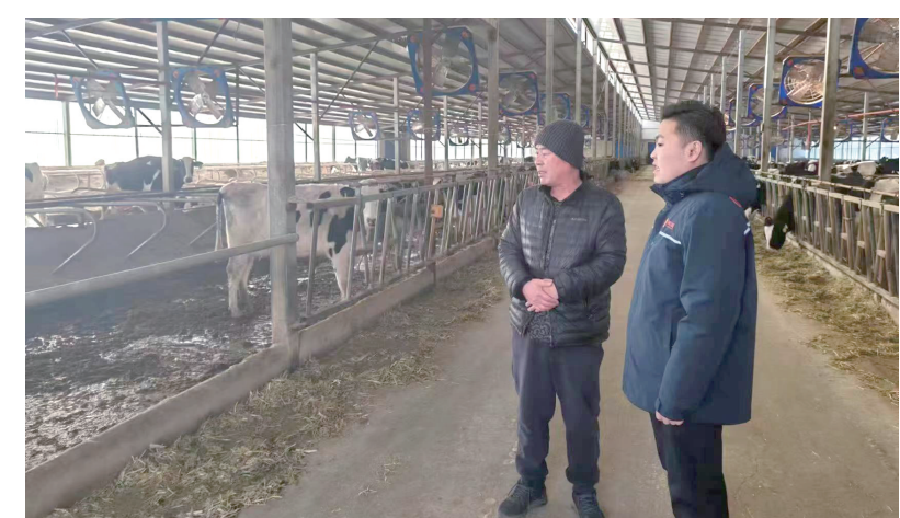
中原农险工作人员在突泉县奶牛养殖专业合作社查验标的并讲解政策。

据悉,该政策性险种由中原农业保险股份有限公司兴安盟中心支公司承保。中原农险作为一家国有专业性农业企业,在服务“三农”、保障特色生鲜乳产业健康稳定发展方面主动担当作为,在兴安盟行署和农牧、财政部门的大力支持下,中原农险扎实开展兴安盟生鲜乳产业链发展特点,摸排历史奶价数据,研究设计适用于兴安盟的生鲜乳价格指数保险产品。2023年起,将在兴安盟科尔沁右翼前旗、突泉县试点开展生鲜乳价格指数保险项目,保障生鲜乳市场价格下跌造成的奶牛养殖户、养殖企业的经济损失,充分发挥保险