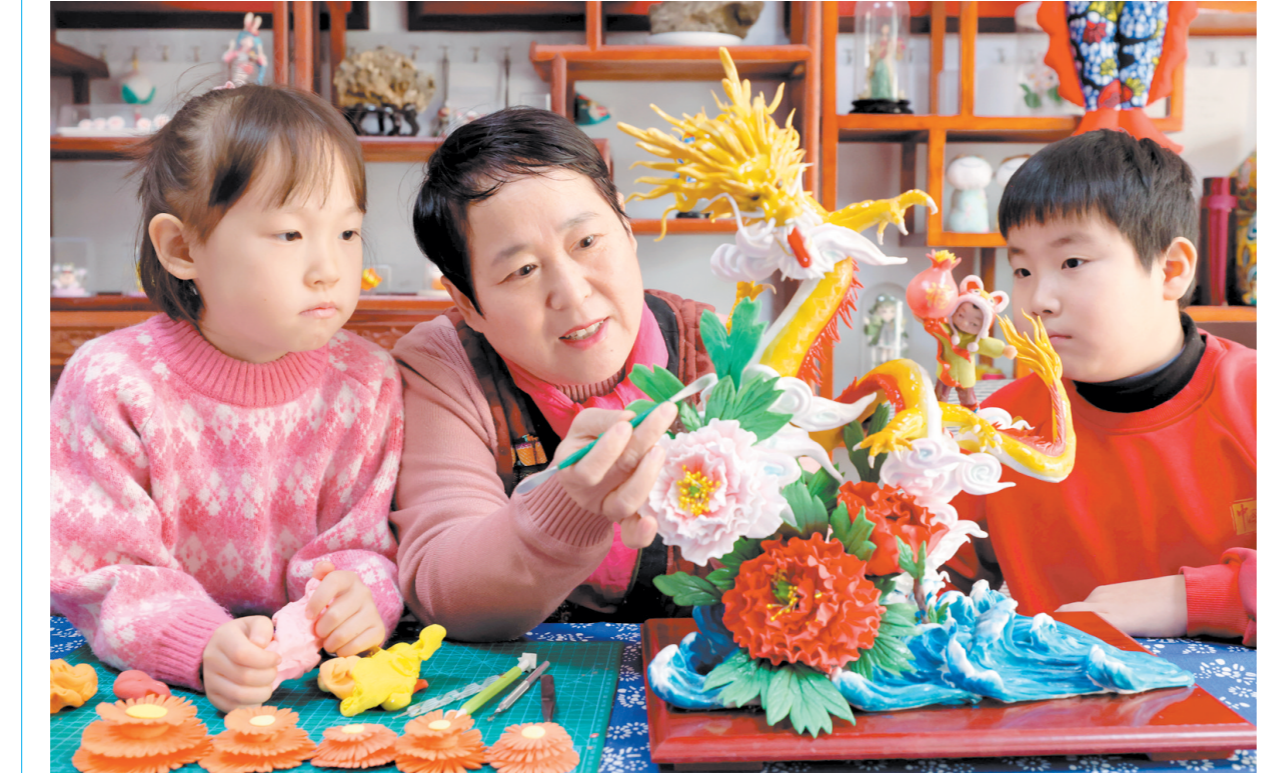
年味渐浓迎新春 1月14日,山东省枣庄市龙山路街道的民间艺人在家中创作面塑作品。春节临近,多地大街小巷年味渐浓,人们在喜庆的氛围中迎接新春佳节。