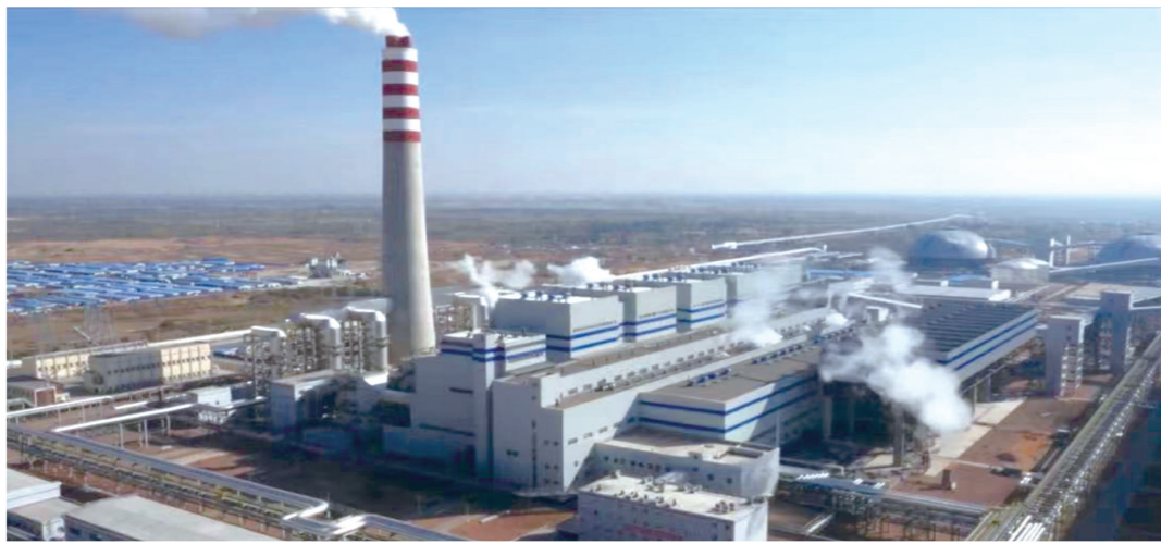
工商银行内蒙古分行为能源企业技术改造和转型升级提供信贷支持。

工商银行内蒙古分行牢牢把握国务院印发的《关于推动内蒙古高质量发展奋力书写中国式现代化新篇章的意见》重大发展机遇，坚持经营发展目标与五大任务目标相统一，经营发展思路与自治区高质量发展路径相统一，经营发展举措与服务实体经济民生需求相统一，努力担当推动地区经济高质量发展的金融主力军。支持筑牢我国北方重要生态安全屏障。持续加大清洁能源、绿色交通、绿色装备制造业、绿色农牧业等重点领域信贷投入，优先保障绿色产业信贷投放。综合运用表内贷款、绿色债券、产业基金等金融手段，积极保障森林生态保育、绿色矿山建设等生态安全重点领域金融服务。重点做好现代化煤矿建设、清洁高效煤电建设等企业融资支持，延伸资源能源产业链，煤炭清洁高效利用再贷款工具审核获批50多亿元，获批金额系统内、可比同业均排名第一。深入对接蒙苏经济开发区零碳产业园入驻企业，一对一出具融资方案，在客户准入、贷款审查审批、利率定价、专项规模配置等方面给予优惠政策，累计为园区企业审批投放贷款30多亿元，为实现绿色能源+交通领域+化工领域的融合发展，提供重要金融服务“引擎”。坚持生态优先、绿色发展导向，支持“三北”等重点生态工程建设，满足钢铁、有色、化工等传统行业绿色转型升级项目融资需求，积极助推节能环保和生