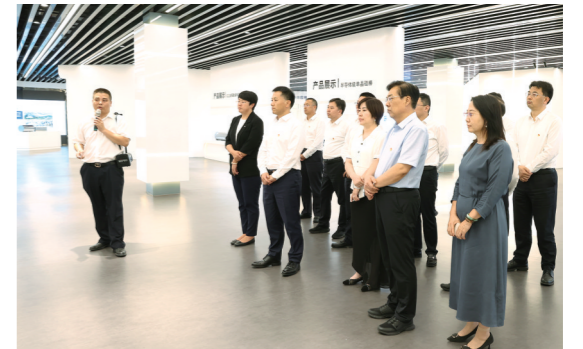
工商银行内蒙古分行党委理论学习中心组赴中环产业园开展调研并学习研讨。