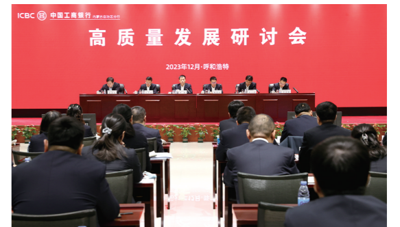
工商银行内蒙古分行召开高质量发展研讨会。