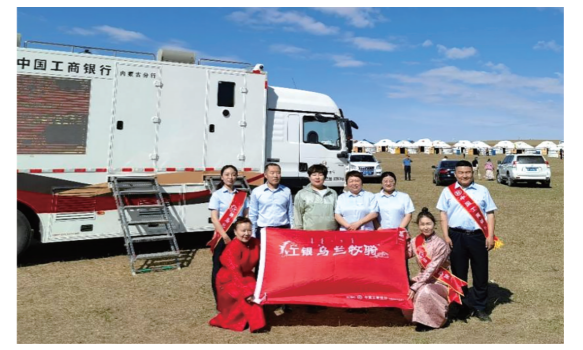
工商银行内蒙古分行工银“乌兰牧骑”小分队驾驶流动银行车打通金融服务“最后一公里”。

工商银行内蒙古分行以服务人民美好生活、促进共同富裕为目标，做好稳投资、促消费、惠民生等领域金融服务，聚焦就业、社保、医疗、住房、养老、新市民等民生重点领域，持续完善金融产品和服务体系，推动金融服务下沉到更多的消费群体和更丰富的消费场景。持续深化科技创新金融服务，以“科创贷”、经营快贷“专精特新”场景建设、包头稀土高新区“积分贷”等重要产品为营销抓手，盘活企业技术、数据、人才等要素价值，加大对国家战略科技力量和“卡脖子”领域支持力度，2023年为自治区内210户国高企业、54户专精特新企业提供融资服务，国高企业有贷户贷款余额达到473.5亿元，专精特新企业有贷户贷款余额达到17.8亿元。全面摸排区内保交楼项目，积极做好呼和浩特某房地产企业保交楼贷款支持，年内顺利投放首笔保交楼贷款，推动已售逾期难交付住宅项目加快建设，尽早完工交付，为妥善化解房地产市场风险、稳定市场信心提供金融助力。用心用情抓好消费者权益保护、金融知识宣教、防控电信网络诈骗工作，客户投诉治理及客户满意度持续提升，电诉涉案账户治理成效持续向好，全年成功堵截欺诈风险事件20起，为客户挽回直接经济损失136万元。