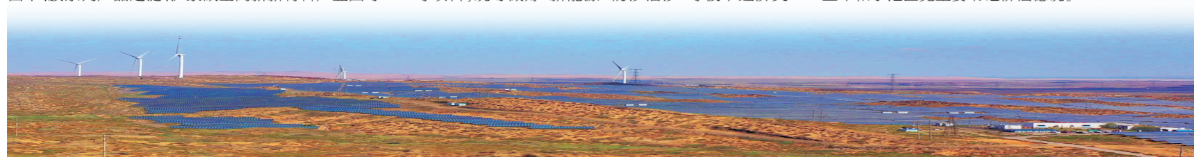
阿拉善高新区、乌兰布和示范区全力打造“先进绿色高载能低排放产业集群示范区”和“绿能迭代合作示范区”。

百舸争流,破浪者领航,千帆竞渡,奋勇者争先。2024年,阿拉善高新区、乌兰布和示范区党工委、管委会将更加紧密地团结在以习近平总书记为核心的党中央周围,守正创新、勤勉实干,解放思想、感恩奋进,大力弘扬蒙古马精神,全力办好两件大事,为推动阿拉善盟经济高质量发展,实现全区闯新路、进中游目标贡献高新区、示范区力量!