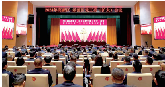
阿拉善高新区、乌兰布和示范区2024年党工委(扩大)会议召开。

围绕打造绿色低碳代合作示范区,阿拉善高新区、乌兰布和示范区将以建设低碳园区、争创“碳达峰”试点、打造“零碳”小镇为抓手,大力发展源网荷储、园区绿色供电、自发自用等新能源项目,逐步实现园区产业迭代升级。加快推进低碳园区建设,重点推动41万千瓦全额自发自用分散式风电、园区绿色供电风光制氢一体化等项目实施,力争到2025年装机规模达500万千瓦,可再生能源电力消费占比不低于50%。积极申报国家第二批“碳达峰”试点,建立完善碳达峰碳中和“1+N+X”政策体系,明确时间表、路线图,推动能耗“双控”逐步向碳排放“双控”转变。加快推进绿能替代,引进建设一批绿电制氢项目,鼓励市场化共享储能项目建设,在贺兰区积极推广绿电照明、绿电供暖等新能源场景应用,全力建设“零碳”小镇。