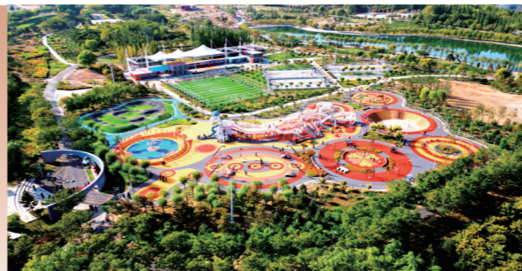
阿拉善高新区、乌兰布和示范区大力实施民生福祉提升行动,健全完善城镇功能,加强城市精细化管理,全面提升城市品质。