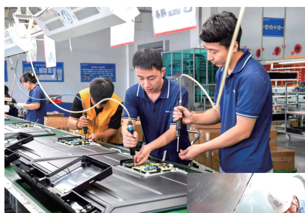
创维智能制造工作人员组装电视。