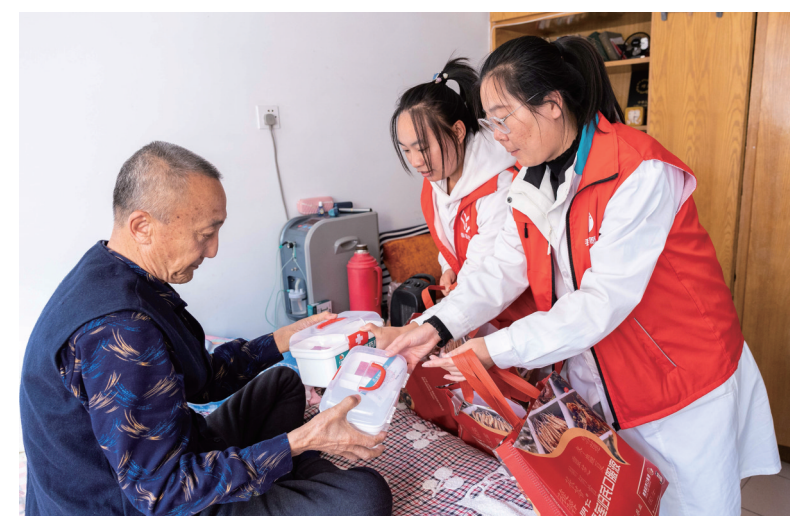
志愿者为患有慢性病的老人赠送“健康礼包”。

高质量发展和最终承载的目标,就是让人民群众过上更加美好更有品质的生活。呼和浩特始终坚持以人民为中心的发展思想,把增进民生福祉、提升群众幸福指数作为开展各项工作的出发点和落脚点,聚焦群众最关心的问题,用心用情用力办好惠民生、暖民心的实事。