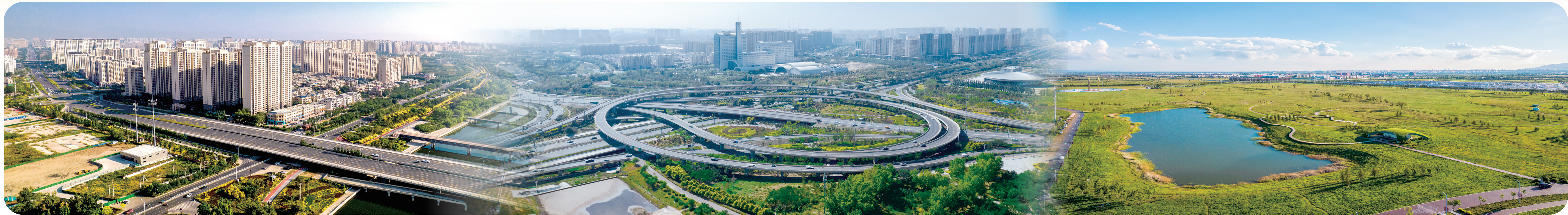
俯瞰城市南部。