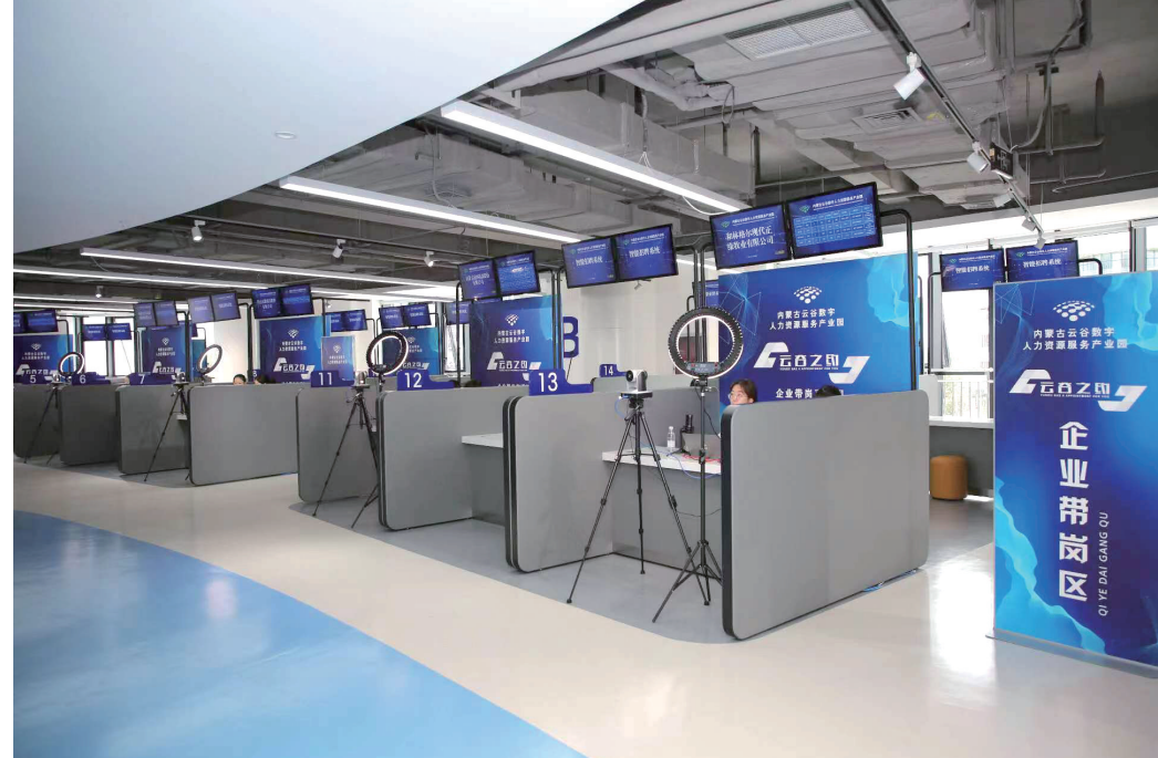
内蒙古鑫环数字人力资源服务产业园。