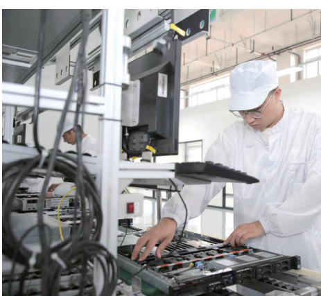
超聚变数字技术有限公司服务器生产项目。

去年以来,不光鑫环10万吨颗粒硅项目建成投产,远景能源制造产业园、华耀光电12GW单晶硅片等项目也相继建成投产,鑫环1万吨电子级多晶硅、中锂三期、圣凯四期等项目主体工程完工,阿特斯光伏产业园一期、双杰电气电力装备制造、鑫锋锂电、国佳纳米负极材料一期、福明智能制造一期等项目开工建设,新材料和现代装备制造产业集群龙头带动作用明显。