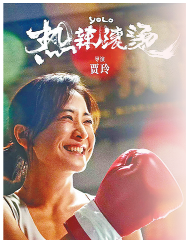
图为电影《热辣滚烫》海报。

在全区上下凝心聚力打造“北疆文化”品牌的具体实践中，如何为“北疆文化”的发展培养更多的有生力量，让北疆大地上的优秀音乐在新时代活起来火起来；如何以内蒙古音乐的传承创新，推动“北疆文化”的繁荣发展，“唱响北疆”内蒙古新星新作演唱会为我们指出了一条切实可行的路径。以一场演唱会来衡量评论内蒙古音乐对“北疆文化”品牌建设所起到的作用，难免有些“管中窥豹”，但是这场演唱会让我们见证了许多动人心弦的瞬间，悠扬的歌声也会在我们的心间久久回荡。