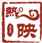
(本版图片除署名外均源自网络)