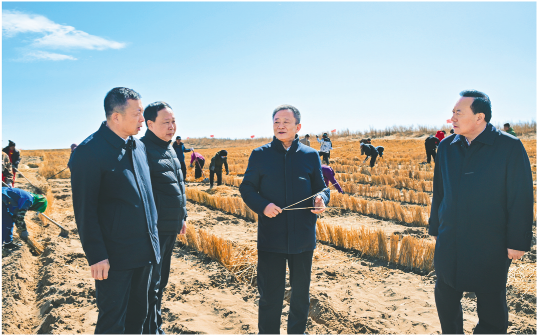
4月9日,孙绍骋来到甘珠尔苏木治沙现场,与干部群众深入交流,了解治沙任务、成本、资金、原料等情况。

本报4月9日讯 (记者李晗)4月9日至9日,孙绍骋深入呼伦贝尔市部分旗市区,就生态保护、防沙治沙、产业发展等重点工作落实情况开展调研。