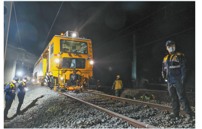
大型养路设备作业中。

到2025年,内蒙古全区铁路运营里程将达1.5万公里,其中高铁里程1000公里。未来将形成区内互联互通,高(快)速铁路覆盖全区所有盟市,普速铁路覆盖全部县域的铁路网络骨架,助力经济发展提速提质。