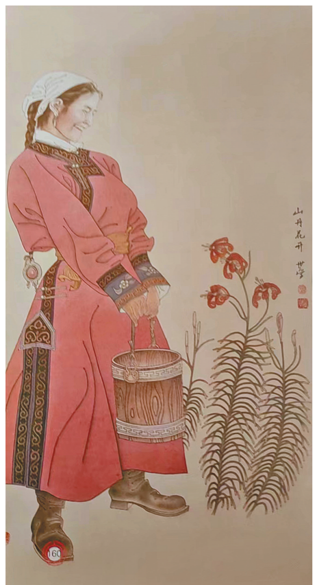
(本文图片为《速写草原》中的画作)