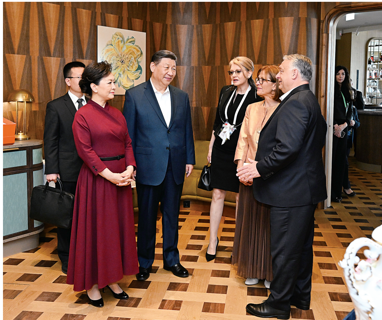
当地时间5月10日中午,国家主席习近平和夫人彭丽媛在布达佩斯应邀出席匈牙利总理欧尔班和夫人举行的饯行活动。