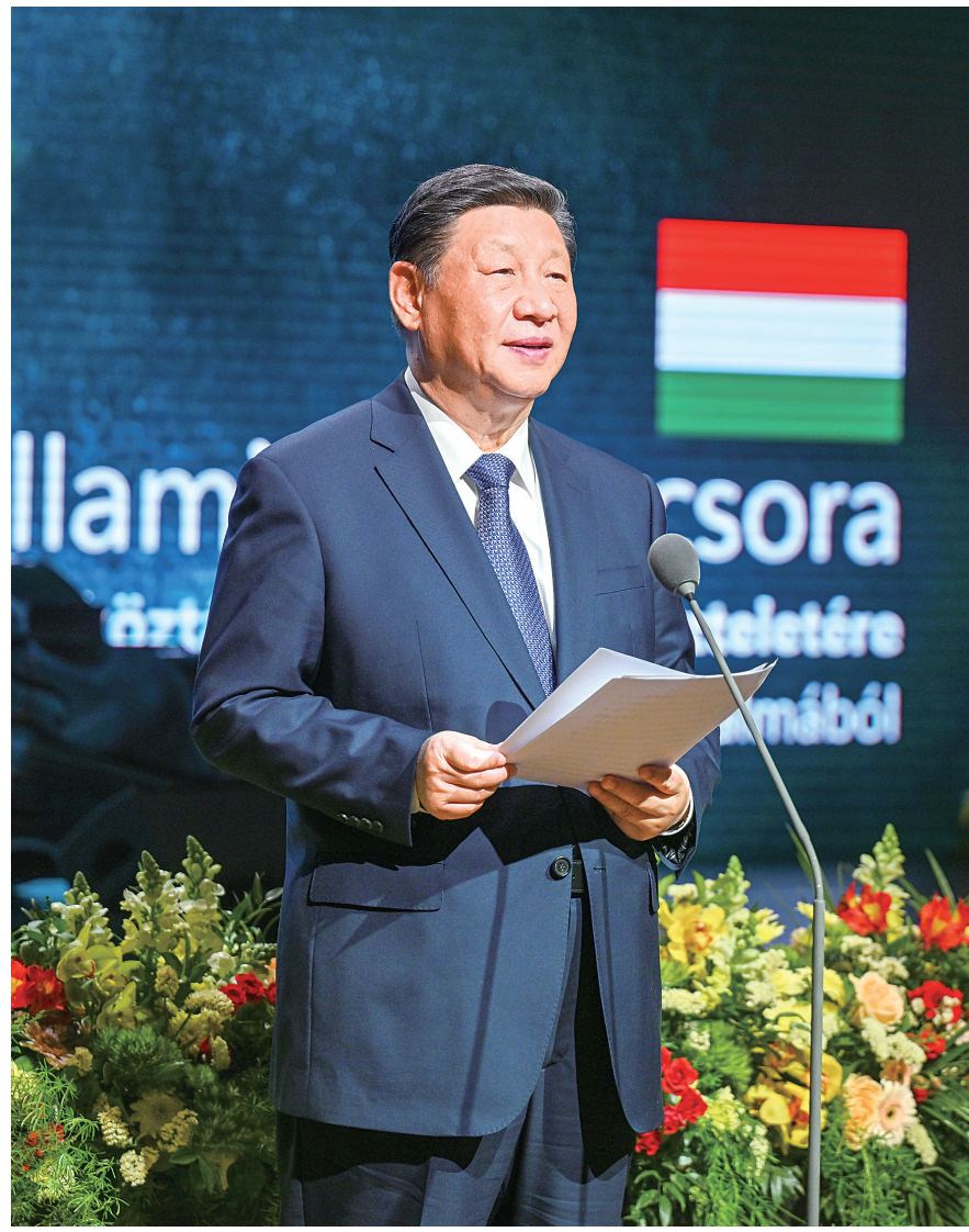
当地时间五月九日晚,国家主席习近平和夫人彭丽媛在布达佩斯城堡山出席匈牙利总理欧尔班和夫人举行的隆重欢迎宴会。这是习近平和夫人彭丽媛在宴会上致辞。

在“新能源绘就农业底色”展区,内蒙古将农牧业与新能源应用相结合,利用实物、视频、图片等, ■下转第4版