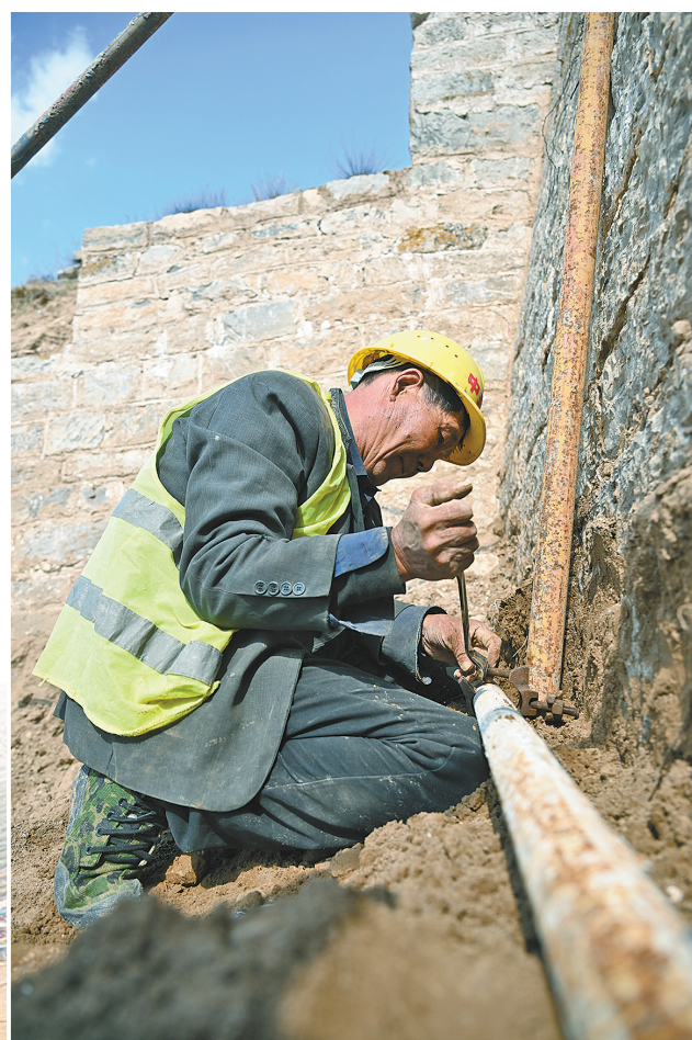
工人在修缮明长城。