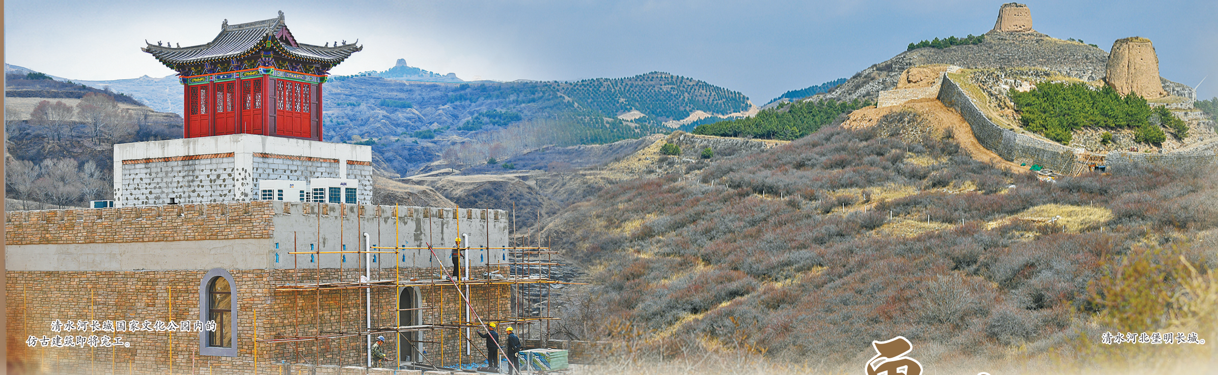
清水河长城国家文化公园内的 仿古建筑即将完工。