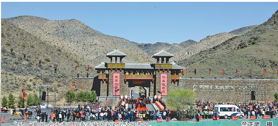
“五一”期间,包头市固阳秦长城国家文化公园开园。