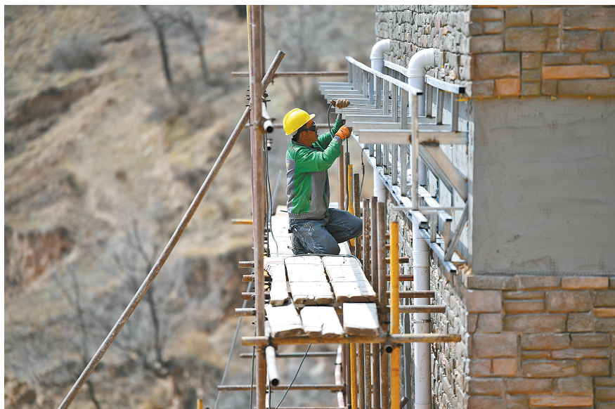
工人正在抓紧施工,确保清水河长城国家文化公园6月底开园试营业。