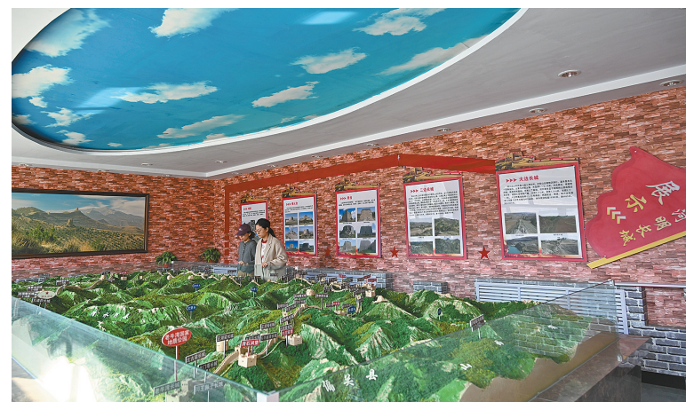
游客在清水河口子上村长城文化展馆内参观。