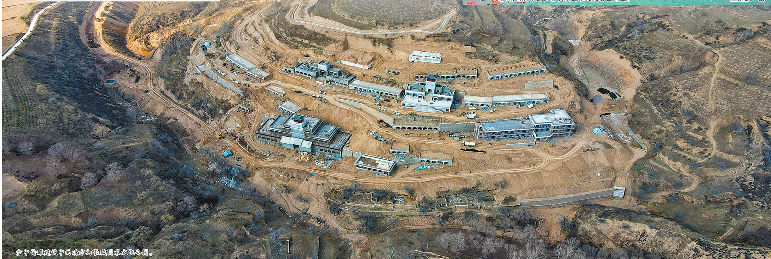
空中俯瞰建设中的清水河长城国家文化公园。