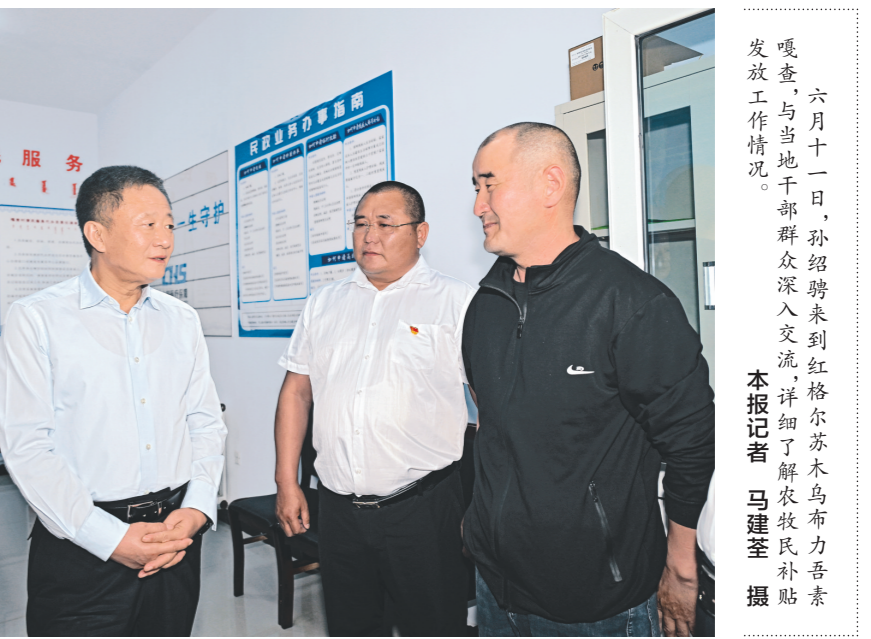
六月十一日,孙绍骋来到红格尔苏木乌布力吾素嘎查,与当地干部群众深入交流,详细了解农牧民补贴发放工作情况。

孙绍骋深入马铃薯种植区和肉羊繁育小区,实地察看马铃薯长势和肉羊舍饲圈养情况,同种植养殖户深入交流,与他们一起算投入产出账。他说,要做好经营土地的文章,积极培育壮大村集体经济,通过发展设施农业、舍饲圈养、庭院经济等多渠道增加农牧民收入。要用好京蒙协作大