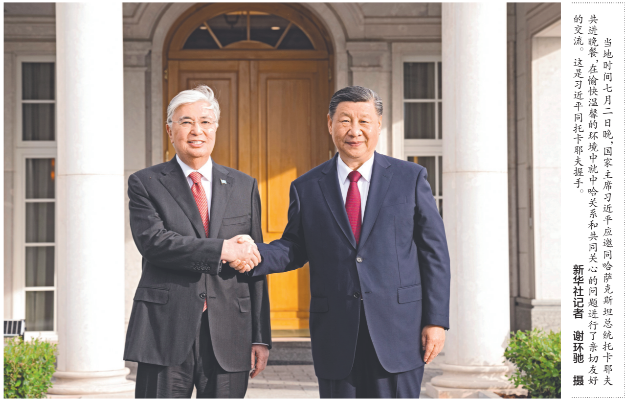
当地时间七月二日晚,国家主席习近平应邀同哈萨克斯坦总统托卡耶夫共进晚餐,在愉快温馨的环境中就中哈关系和共同关心的问题进行了亲切友好的交流。

新华社阿斯塔纳7月2日电 当地时间7月2日晚,国家主席习近平应邀同哈萨克斯坦总统托卡耶夫共进晚餐,在愉快温馨的环境中就中哈关系和共同关心的问题进行了亲切友好的交流。