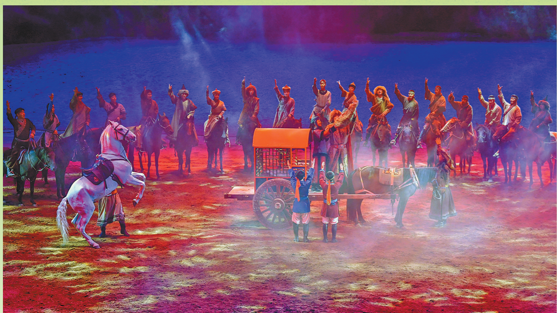
全景式大型马舞剧《千古马颂》已成为弘扬草原文化的一张亮丽名片。