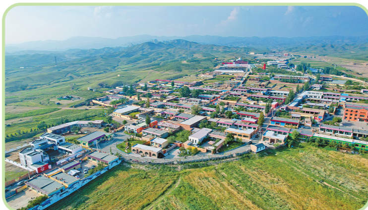
航拍镜头下的包头市青山区东达山度假村。