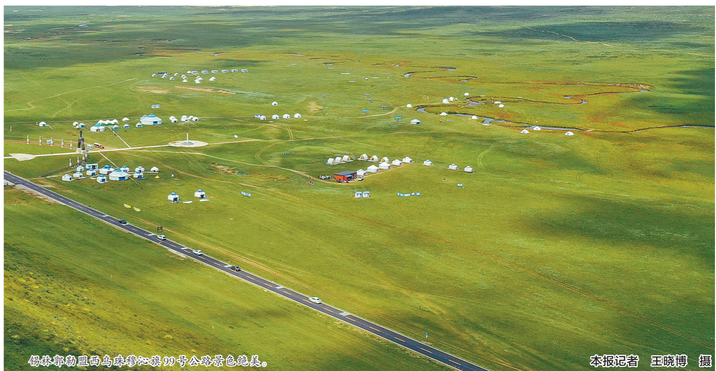
锡林郭勒盟西乌珠穆沁旗99号公路景色绝美。