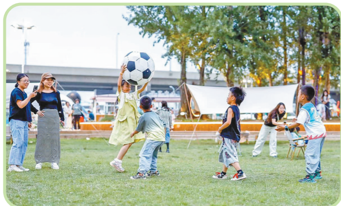
呼和浩特市赛罕区大黑河北岸的“花海之约”露营地成为假期热门打卡地。