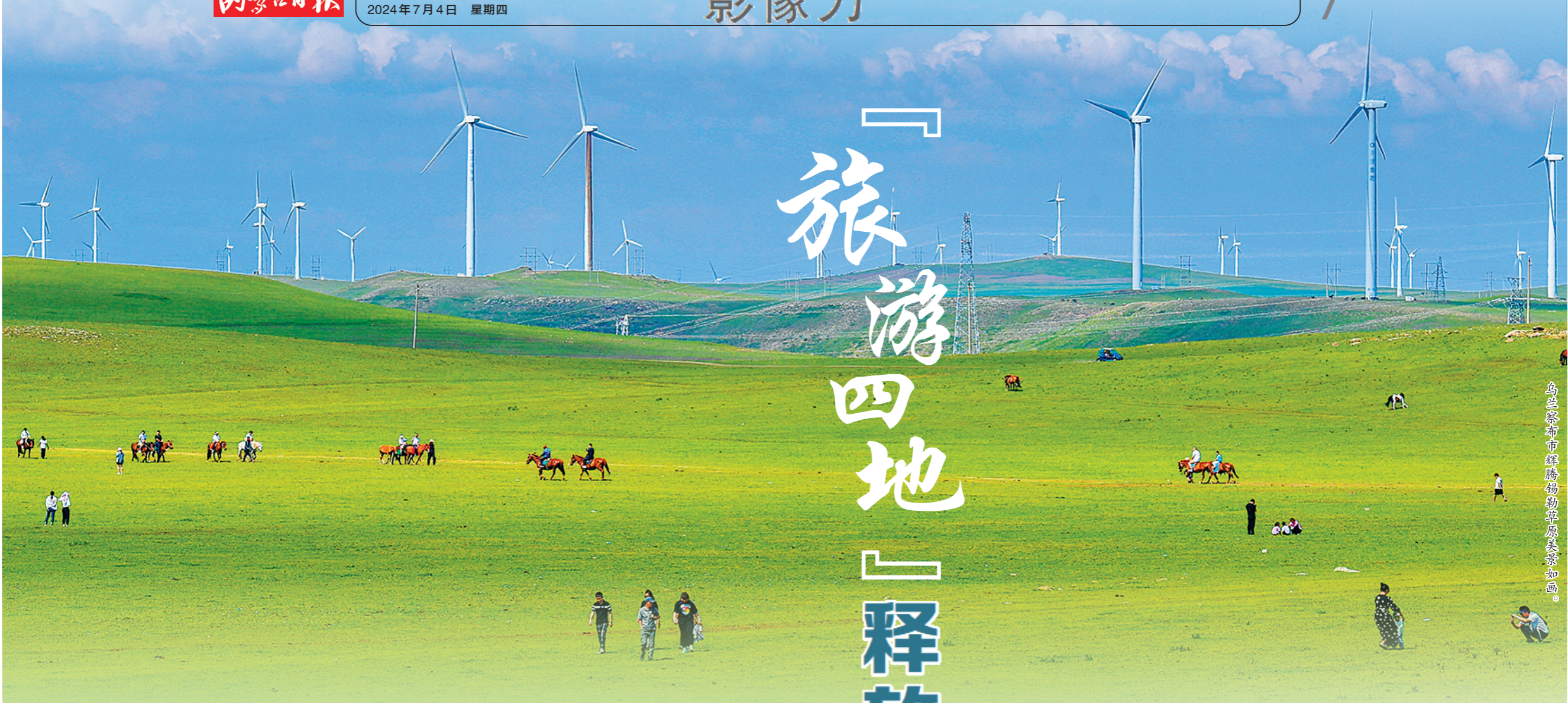
乌兰察布市辉腾锡勒草原风光如画。