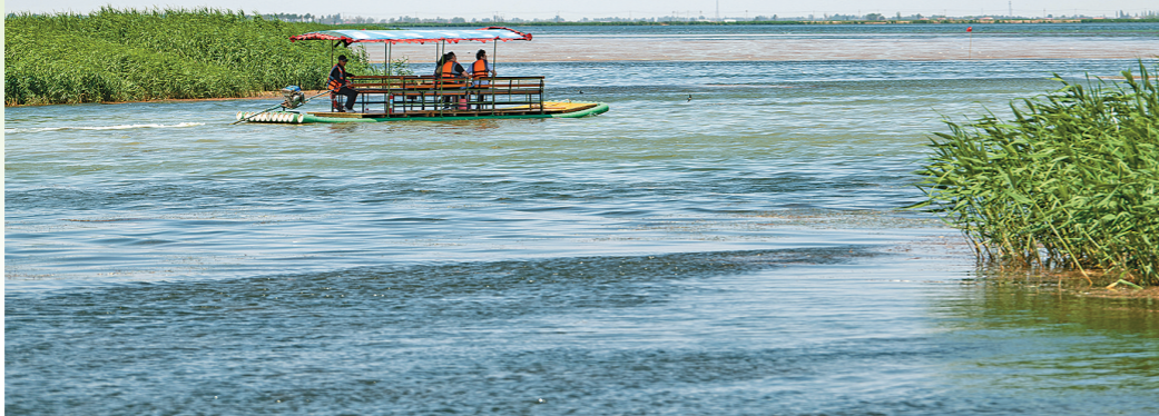
游客乘船畅游乌梁素海。