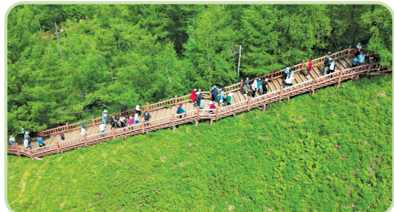
阿尔山国家森林公园满目苍翠，如诗如画。