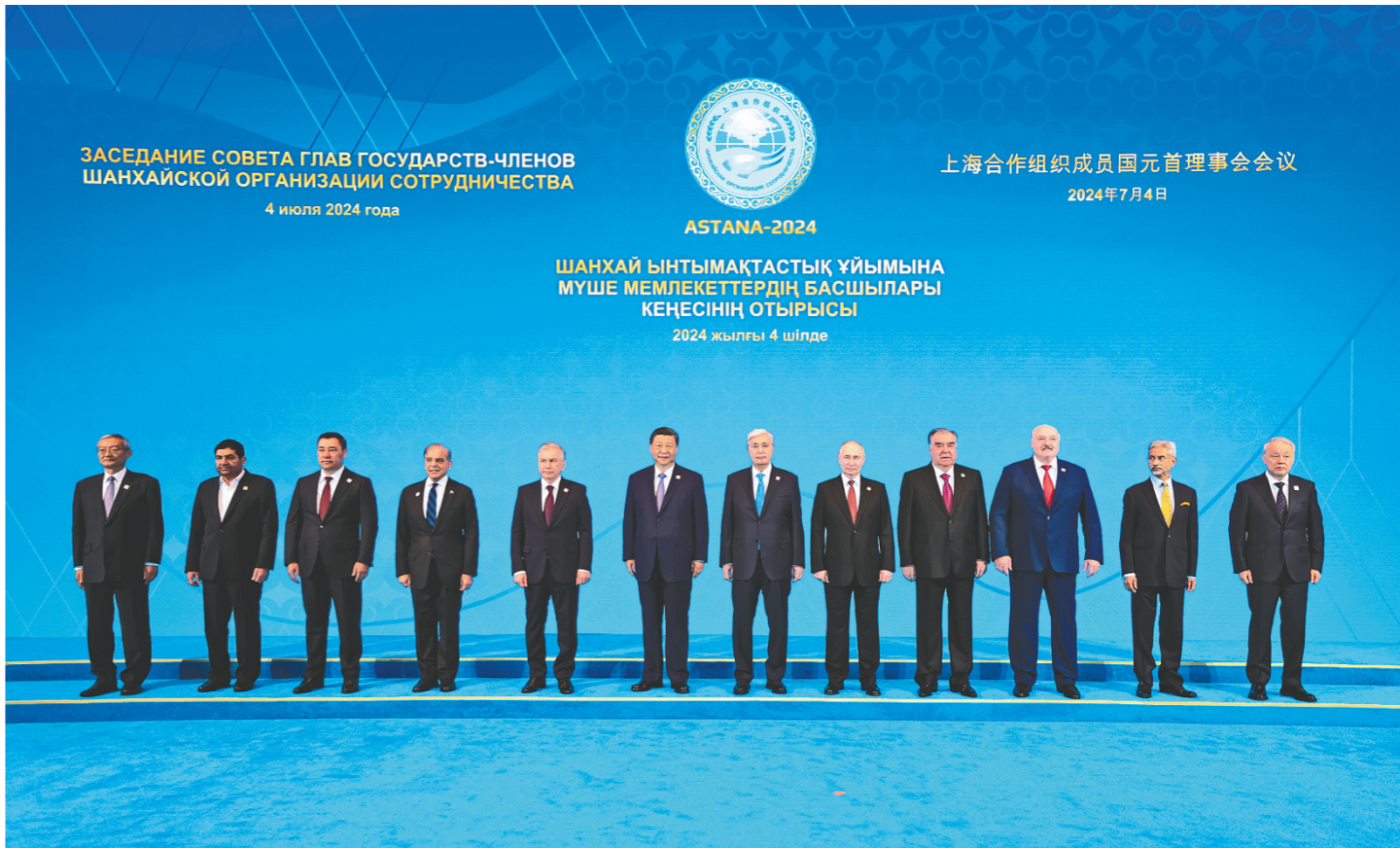
当地时间7月4日上午，国家主席习近平在阿斯塔纳独立宫出席上海合作组织成员国元首理事会第二十四次会议。这是习近平同上海合作组织成员国领导人集体合影。