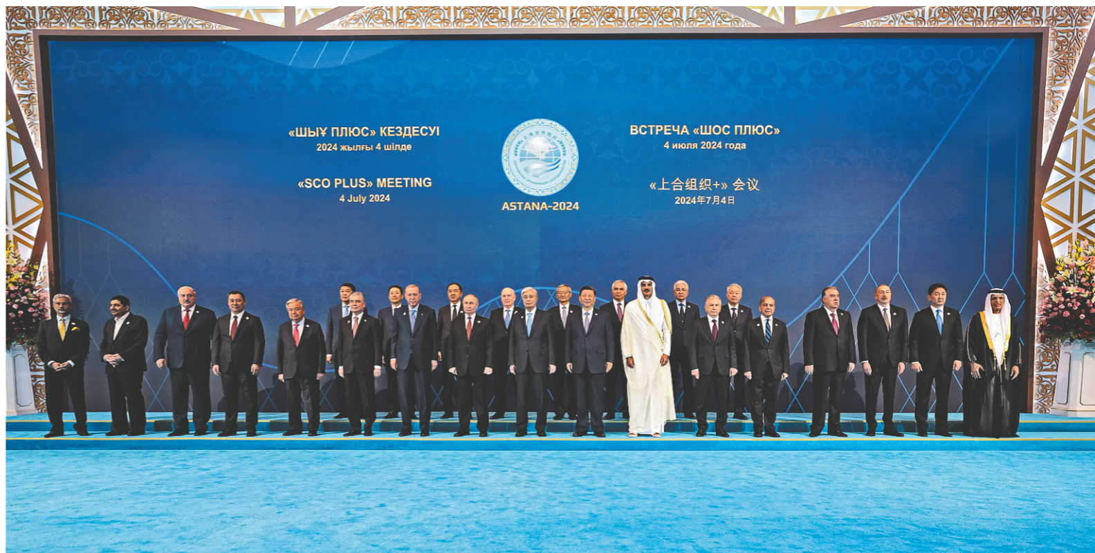
当地时间7月4日下午，国家主席习近平在阿斯塔纳出席“上海合作组织+”阿斯塔纳峰会并发表题为《携手构建更加美好的上海合作组织家园》的重要讲话。峰会开始前，习近平出席托卡耶夫为与会代表团团长举行的欢迎宴会并集体合影。