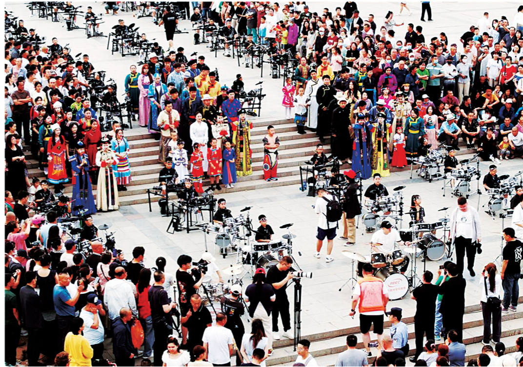
七月十日,在锡林浩特市贝子庙广场上,迎接“相约草原 喜迎那达慕”民族服饰走秀、架子鼓演奏以及小搏克手表演吸引了众多市民、游客驻足观看。

生命财产安全和社会大局稳定。 《通知》要求,各级领导干部要强化政治责任,率先垂范奋战在前;基层党组织要发挥“五个堡垒”作用,带领广大党员有序开展防汛救灾各项工作;各级党组织要树牢担当作为正确导向,激励党员干部不畏艰险勇于攻坚克难;相关行业职能部门党组织和党员干部要闻令而动、听命而行,有效排查化解风险隐患。