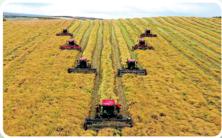
油菜绿色高质高效攻关田集中收获。