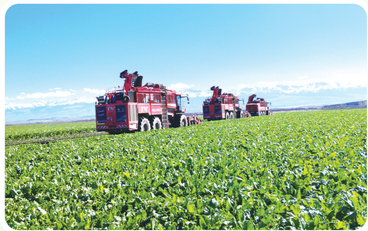
农垦机械赴新疆开展社会化服务。