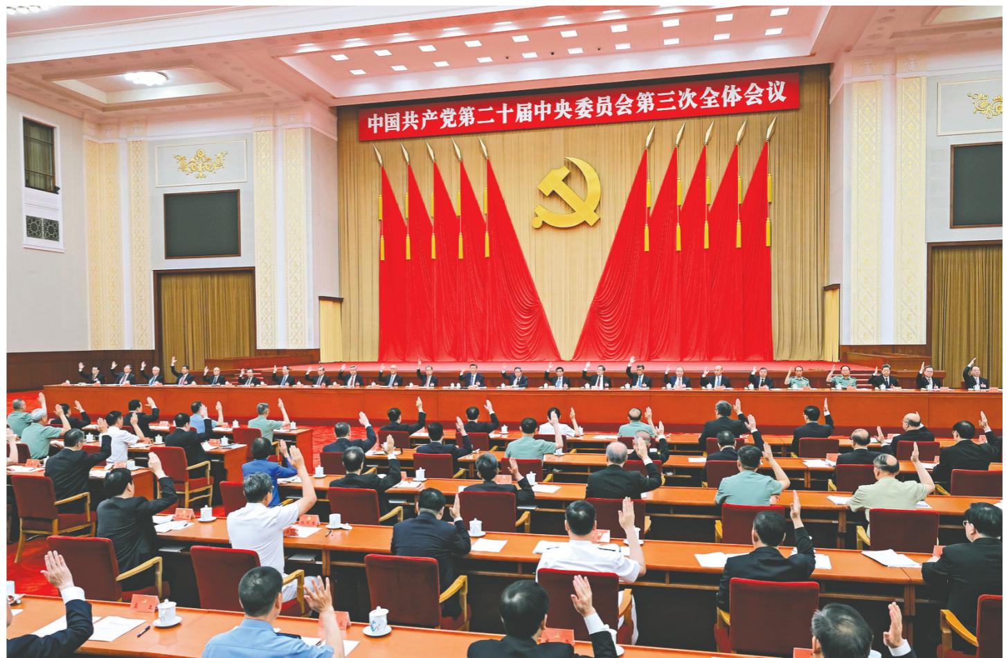
中国共产党第二十届中央委员会第三次全体会议,于2024年7月15日至18日在北京举行。中央委员会总书记习近平作重要讲话。