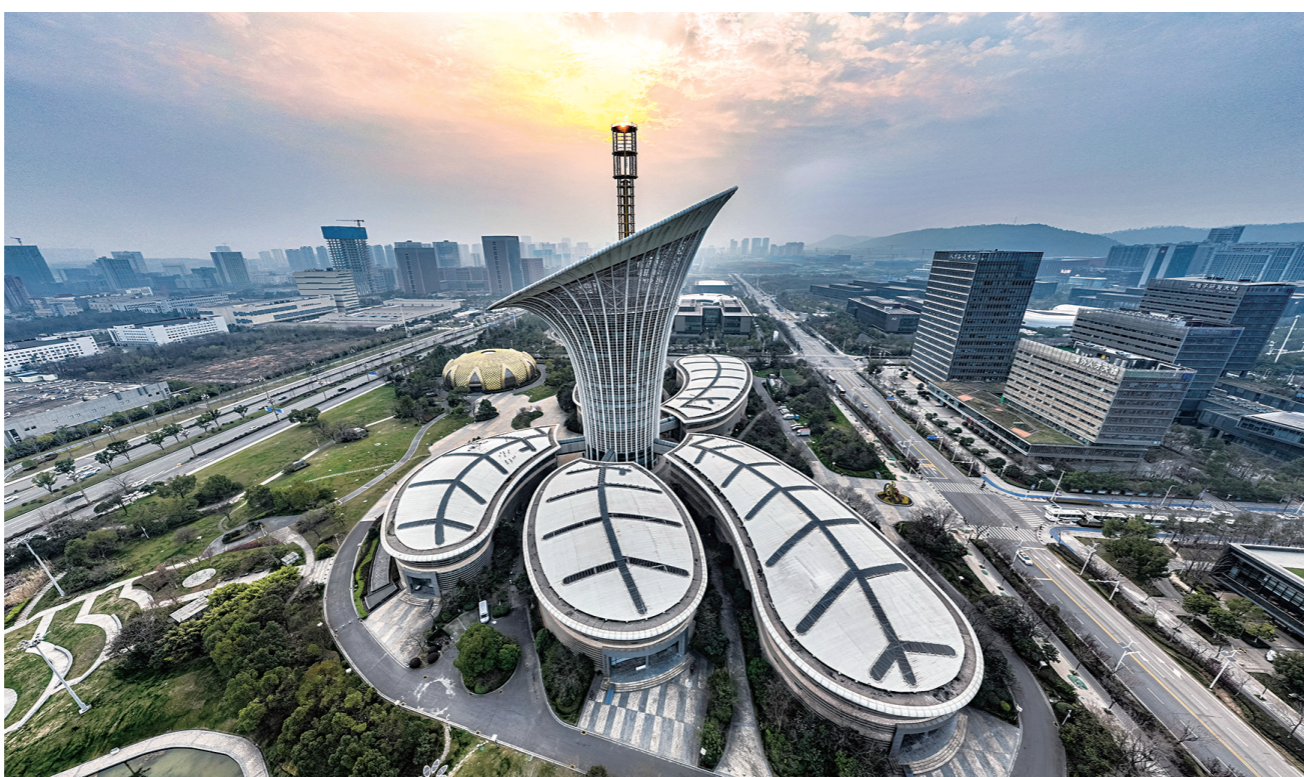
位于武汉中国光谷未来科技城的武汉新能源研究院大楼(2024年3月16日摄,无人机照片)。

加快制度供给、完善产业生态:河南省科技厅出台大力培育创新龙头企业、提升产业链整合能力的措施,广东