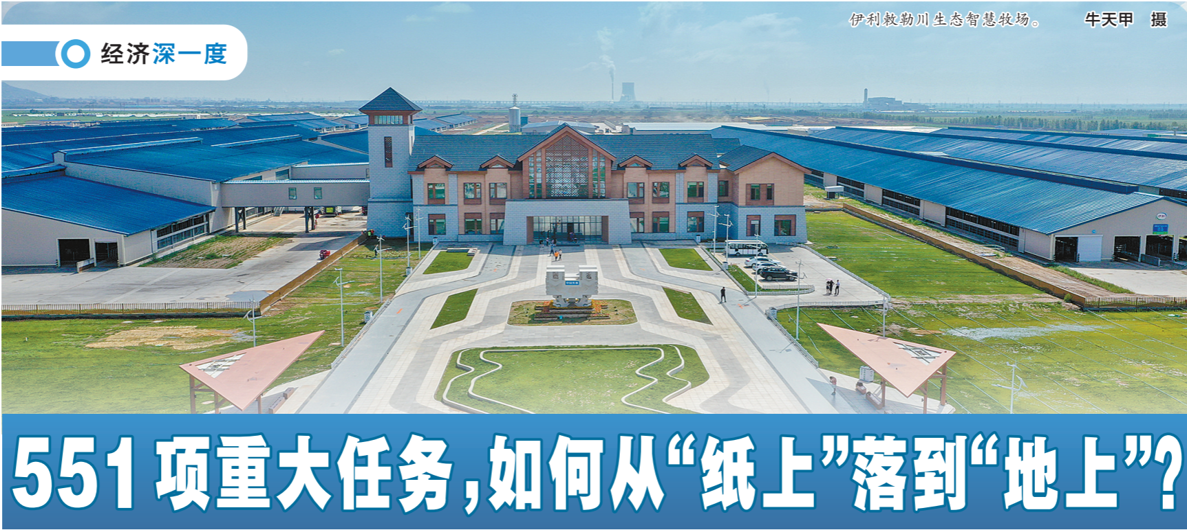
伊利牧勒川生态智慧牧场。

以新能源带动经济绿色转型高质量发展。加快构建现代能源经济体系,增强创新绿色发展能力。整体优化煤炭开发布局和接续产能,建立煤炭产能储备制度,全年煤炭产量稳定在12亿吨左右。新增支撑性和调节性煤电规模200万千瓦,切实提升电力供应保障能力,继续推进煤电“三改联动”。加快电网核准,今年以来核准500千伏及跨盟市220千伏电网工程27项,增强地区电力供应和外送能力。围绕产业链部署创新链,充分发挥绿电优势,推动新能源和其他产业耦合发展,以新能源带动新工业,引领经济绿色转型,重点围绕新型储能、氢能、新能源装备制造、新型电力系统等领域推进科技创新,促进在能源领域快速形成新质生产力,抢占未来产业制高点。