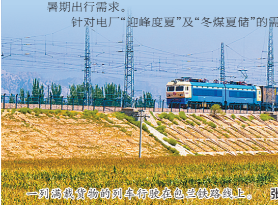
铁路工作人员查验旅客身份信息。

自治区国资委消息:近日,“内蒙古自治区社会科学基金2024年度高质量发展专项立项名单”公示,由内蒙古电力科学研究院牵头申报的“内蒙古氢能产业发展调研立项”项目首次成功获批,实现自治区相关社会科学基金项目申报零的突破。