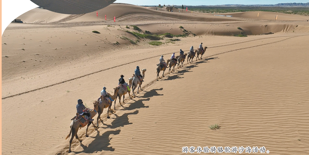
游客体验骑骆驼游沙漠活动。