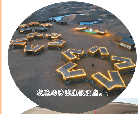
夜晚的沙漠度假酒店。

活得天独厚的沙漠资源，依托绚丽的自然风光和深厚的人文底蕴，积极引导牧民发展沙漠休闲民宿产业，持续提升旅游接待服务能力和水平，鼓励牧民改造具有鲜明地域特色的民宿、客栈、牧家游，吸引游客从“到此一游”的短暂停留转变为“深度体验”的长期驻足，进而实现“游客”向“留客”的华丽转身。如今，该示范区建设特色沙漠民宿占地面积约为28平方公里，建有75家风格各异的营地，建有星空房、太空舱、沙漠房及各类野奢帐篷6000余间，可同时接待游客12000余人。今年以来，累计接待游客43.8万人次，实现旅游综合收入2.63亿元，同比增长35.2%和26%。