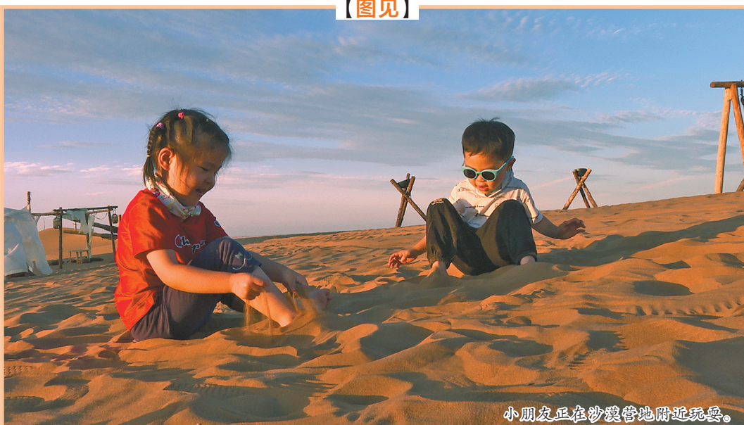
小朋友正在沙漠腹地附近玩耍。