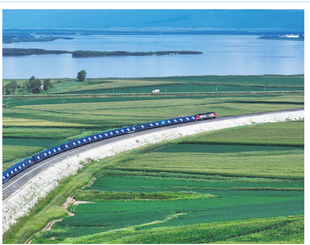
中欧班列“东通道”通行量突破30000列

记者从中国铁路哈尔滨局集团有限公司获悉,截至2024年8月20日,中欧班列“东通道”满洲里、绥芬河、同江铁路口岸累计通行量突破30000列、发送货物291万标箱,实现连年增长,呈现量质齐升的良好态势,为服务高质量共建“一带一路”注入了新动能。图为一系列载重55箱的中欧班列驶出黑龙江同江北站(无人机照片)。