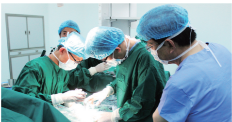
不断完善医疗卫生服务体系,让百姓在家门口享受三甲医院医疗服务。