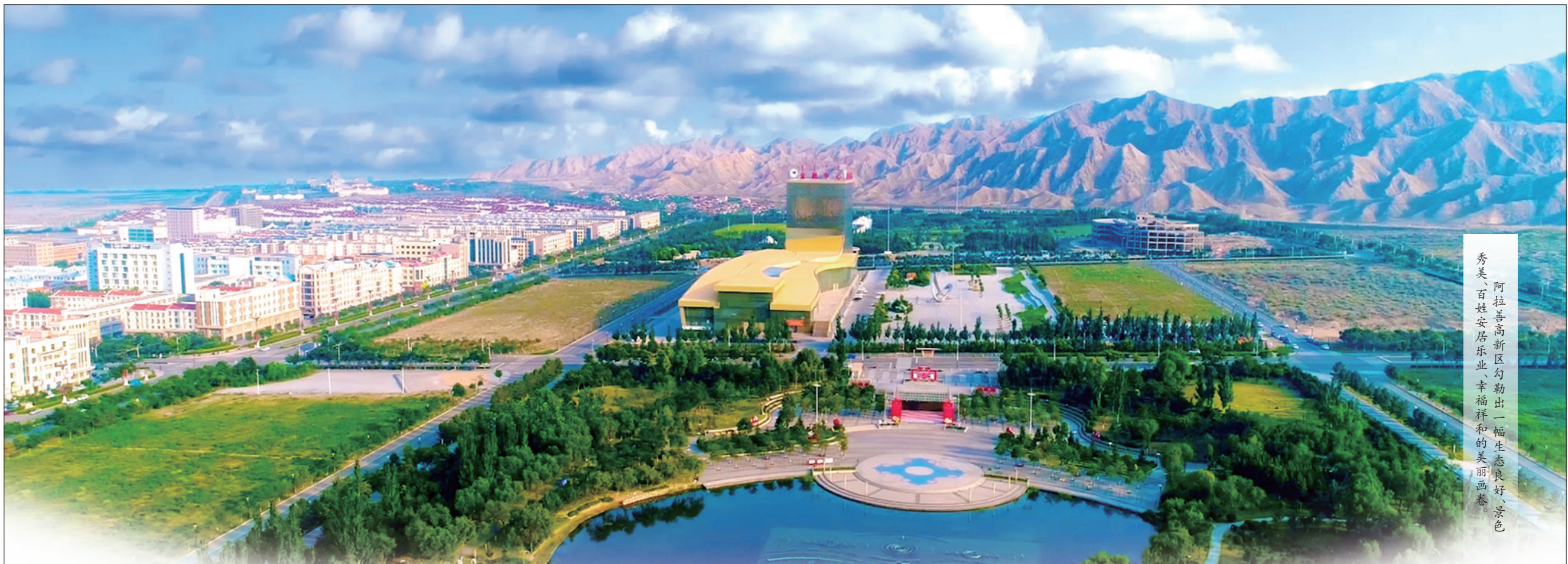
秀美、百姓安居乐业、幸福祥和的美丽画卷