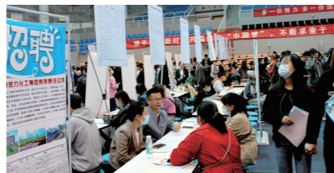
坚持就业优先导向,让稳就业托起老百姓“稳稳的幸福”。

民有所呼,政有所应。如今,伴随着一项项民生工程的接力赛跑,一项项看得见的民生实事,一桩桩摸得着的民生红利落地做细,让群众最关心、最直接、最现实的民生清单变成幸福账单,该高新区、示范区日益织密织牢了一张多层次、广覆盖、立体式、全纵深的民生保障网,彰显了“以人民为中心”的理念,让人民群众幸福指数不断提升。