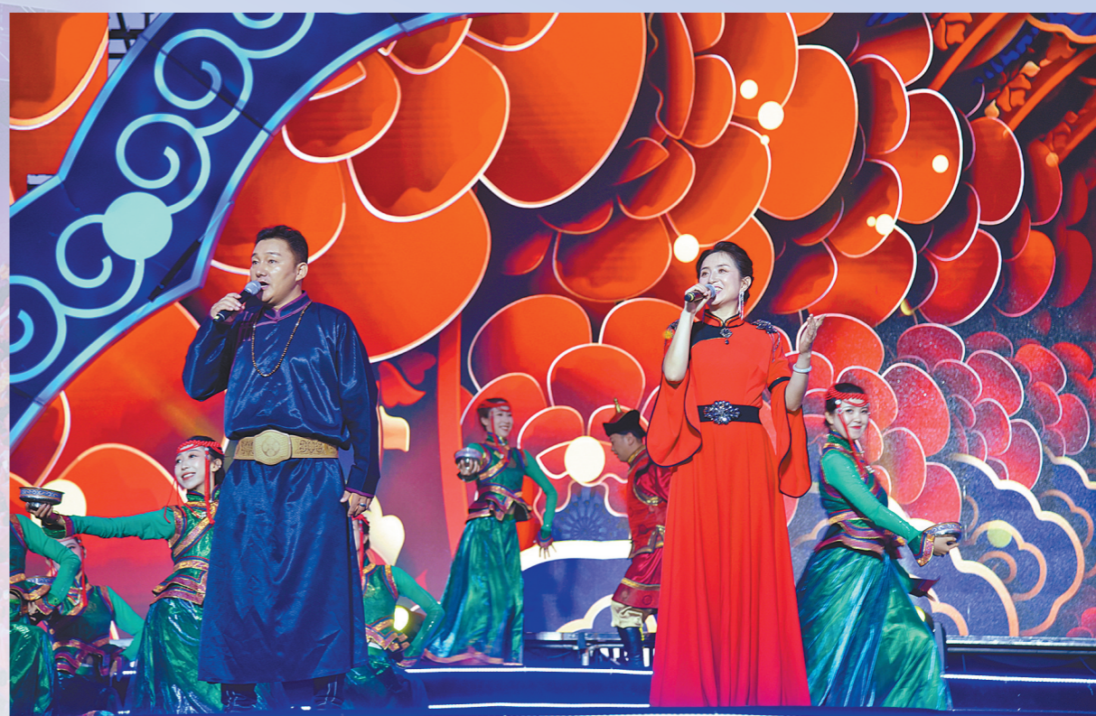
演员在“唱响北疆”2024内蒙古民歌大会上倾情演唱。初秋时节,来自全国的优秀民歌音乐人齐聚乌海,为观众呈现一场民歌盛宴。