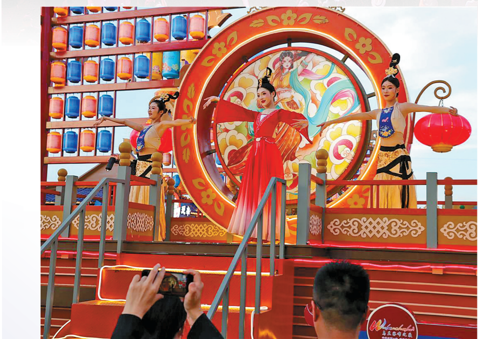
在“乌兰察布之夜”旅游休闲街区,12处主题演绎轮番上演,“塞上弦乐”“篝火盛会”等精彩节目,带领游客穿越古今,领略地方风貌。