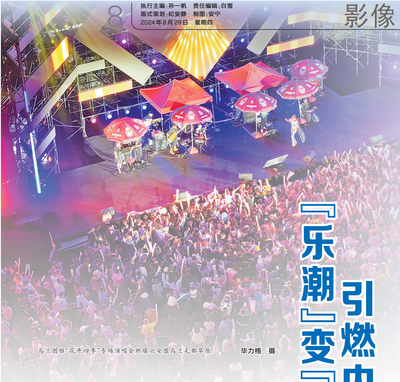
乌兰图雅“花开四季”专场演唱会燃爆兴安盟乌兰毛都草原。