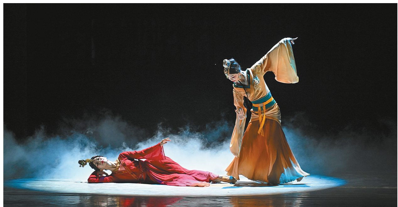
在第二十五届呼和浩特昭君文化节上,沉浸式大型民族舞剧《昭君》专场文艺演出精彩上演。为期一个月的文化节系列活动将带领游客沿“昭君出塞”之路沉浸式体验中华文化。

文旅经济发展的“高光时刻”,少不了一场场演艺活动的“持续高歌”。随着跨城观演成为演出市场的新风尚,在内蒙古,“演出+旅游”的融合模式,催生出多姿多彩的文旅消费新画卷,演艺产业链辐射带动效应凸显,蓬勃发展的演艺经济,为文旅深度融合注入更多新动能,成为推动文化产业发展的新引擎。