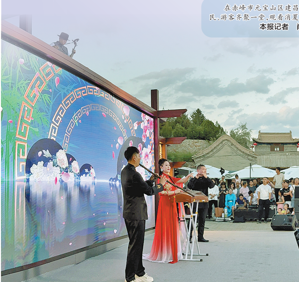
在赤峰市元宝山区建昌营村,村民、游客齐聚一堂,观看消夏演出。