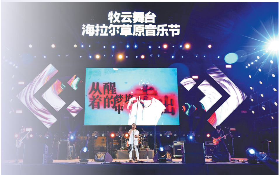
呼伦贝尔·海拉尔草原音乐节上,许巍等众多深受乐迷们喜爱的乐队和音乐人齐聚呼伦贝尔,为乐迷们带来了一首首燃爆全场的歌曲。