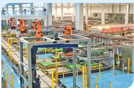
在伊利现代智慧健康谷,各条生产线正在高速运转。作为奶业绿色发展的引领者,伊利始终秉持“绿色领导力”理念,打造“绿色产业链”,自治区内多家工厂被评为绿色工厂。