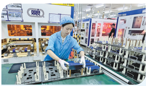
双良硅材料(包头)公司生产车间内一片繁忙,该公司注重绿色发展,是自治区级绿色工厂。