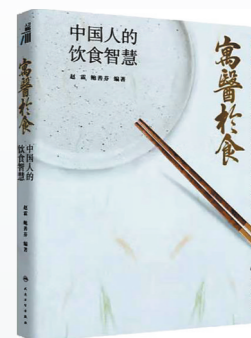
《寓医于食:中国人的饮食智慧》 出版社:人民卫生出版社 编著:赵霖、鲍善芬

内容简介: 冯唐半生成事哲学新作,稳住自己就赢了。本书用54篇全篇文章,讲透步步稳赢的秘诀:用好脑力、体力、心力,则万事可成。用好脑力——“用好智慧,人间稳赢”,读书行路,良师益友支持,持续思考创造;用好体力——“肉身不坏,抵御一切妖邪气”,管好肉身、能量、精力、情绪,成事不殆;管理好心力——“身历百千劫,还是一颗活泼心”,气定则心定,心定则事成,心力越强,赢得越稳。