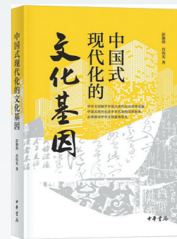
《中国现代化的文化基因》 出版社:中华书局 作者:彭璐璐 肖伟光

强调要加大研发投入,加强知识产权保护,培育创新型企业,提高自主创新能力;在国际贸易方面,认为要积极参与全球经济治理,推动贸易和投资自由化便利化,拓展国际市场空间。书中运用丰富的实例和数据,深入浅出地阐述了经济发展的内在规律和逻辑。让读者不仅能够了解到具体的经济现象和问题,更能学会从宏观和微观两个层面去思考和