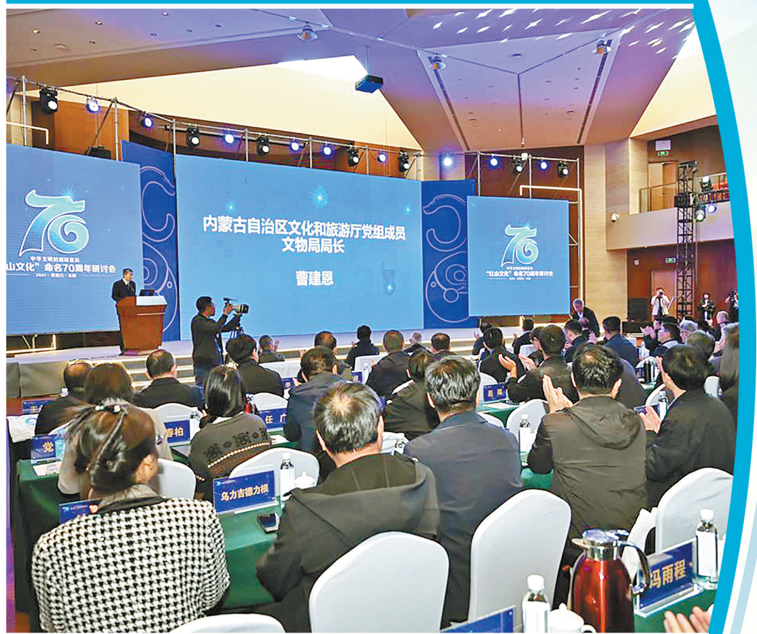
“红山文化”命名70周年研讨会现场。

红山文化，是中国文明起源研究中具有引领作用的中国考古学文化之一。红山文化发掘与研究取得的一系列重要成果，对探讨中华文明起源、中华民族形成过程具有重要意义。红山文化以大小凌河和西辽河流域为中心分布，其遗址广泛分布在现代行政区划上的辽宁省西部、内蒙古自治区东南部和河北省北部。今年恰逢“红山文化”命名70周年，70年来，内蒙古、辽宁、河北等省区与中国社会科学院考古研究所、吉林大学等单位的考古工作者，深耕田野探求真象，不断揭示红山文化丰富内涵。《内蒙古日报》与《辽宁日报》《河北日报》推出联动特别报道，展现红山文化发掘与研究的辉煌历程。