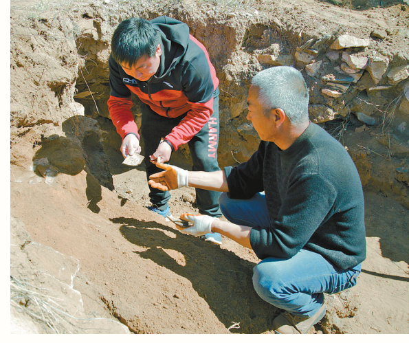
考古人员清理红山石冢。

红山，既是一座位于西辽河流域上的秀美奇峰，也是一支著名的史前考古学文化。辽宁，正处于红山文化的重要分布区。近百年以来，辽宁持续不断地躬身发掘、持之以恒地深入研究、全力以赴地宣传展示，不断向世界叫响红山文化。 1921年6月，瑞典地质学家安特生在今天的辽宁省葫芦岛市南票区孙家湾遗址进行考古发掘，发现红山文化遗物。这是红山文化遗址首次被发现，自此掀开了长达百年的红山文化发掘序幕。 百余年来，辽宁考古工作者孜孜以求，相继发现了阜新胡头沟墓地、喀左东山嘴建筑基址、朝阳牛河梁遗址、凌源田家沟墓地、朝阳半拉山墓地等一大批重要红山遗址，为廓清红山人生产生活方式、祭祀礼仪习俗作出了重要贡献。尤其是处于红山文化晚期、位于辽宁省朝阳市凌源与建平交界处牛河梁遗址的发现，不仅证明了中国历史上最早的国国诞生在辽宁大地，“北庙南坛”中轴线布局诞生于此，玉文化的源头之一在辽宁，而且以确凿的证据证明了在中华文明漫长的演进进程中，位于北方的红山文化曾领先一步，对中原文化产生过重大影响。 如今，辽宁考古工作者对红山文化的探寻仍在进行中——牛河梁遗址第一地点台基址的进一步细化；红山文化早期马鞍桥山遗址的进一步厘清，三家东北遗址的进一步有序发掘，都让红山文化的面貌越来越清晰。近些年来，辽宁考古部门紧盯红山文化做文章，稳步推进中华文明探源工程和“考古中国”重大项目考古调查和发掘工作，共完成4900平方公里考古调查和2800平方米考古发掘任务，完成牛河梁遗址周边17处大型聚落址77万平方米的考古勘探任务，并取得了重要收获。 如果说发掘与研究为叫响红山文化奠定了十足底气，那么，辽宁通过展览展示、宣传推广、文化创意等一系列手段，则是叫响红山文化的具体举措。 红彤彤的剪纸，淡黄色的相框，满族剪纸技艺与红山文化玉猪龙有机融合，这样独具匠心的文创冰箱贴刚一亮相辽宁省博物馆，就受到观众热捧。这只是辽宁将红山文化具象化、让红山文化动起来、热起来的举措之一。 近几年，辽宁不断加大红山文化的宣传推广力度，从辽宁省博物馆“古代辽宁”展厅中的专属陈列，到“又见红山”大型展览的推出，“红山热”的浪潮不断涌起，在观众中形成一个又一个文化现象。 与此同时，辽宁近年来不断让红山文化走出去。从南京博物院的“玉润中华——中国玉文化的万年史诗画卷”大型特展，到在国家博物馆、陕西历史博物馆、安徽博物院等一些国内重要展馆，红山文化那些或抽象或具象，或灵动或朴拙的红山玉器，既彰显着5000多年前西辽河流域史前文明的神秘，也让外界知晓了红山文化的独特魅力。 站在红山文化命名70周年的这一新起点上，辽宁正不断开拓创新，谋求持续研究、保护和宣传好红山文化，让这一在中华文明进程中占据着重要地位的史前文明愈加熠熠生辉，光彩照人。