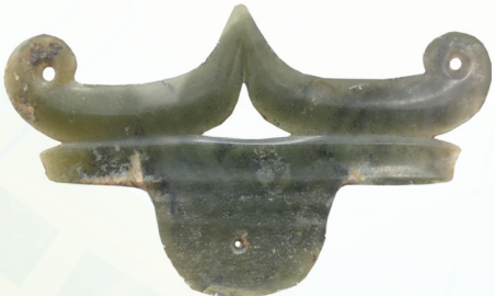
敖汉旗元宝山红山石冢遗址出土的玉器。（内蒙古自治区文物考古研究院提供）