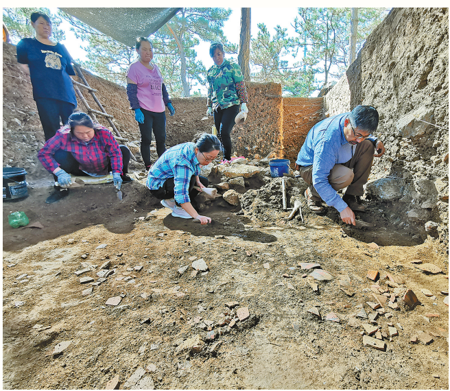
牛河梁遗址考古发掘现场。