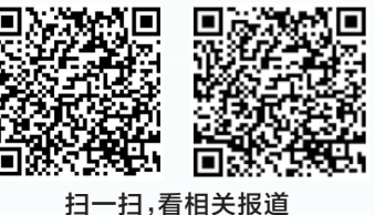
扫一扫，看相关报道

联动特别报道团队： 《辽宁日报》首席记者 朱忠鹤 《河北日报》记者 龚正龙 《内蒙古日报》记者 孙一帆 崔楠 于涛 闫晨光 怀特乌勒斯 李卓 李倩 贾奕村 程英军 王鹏 庄固 马嫣然 王彬 李超然