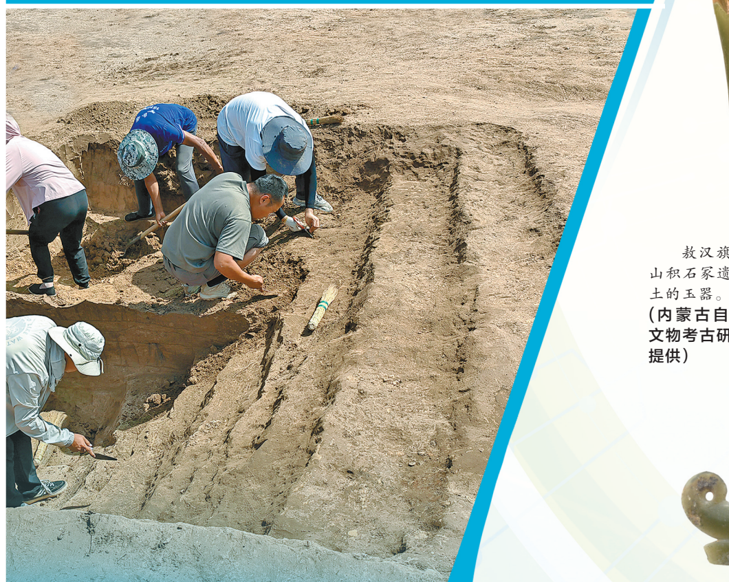
考古人员在现场发掘文物。