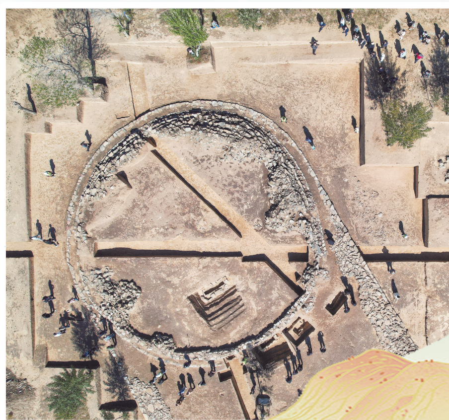
敖汉旗元宝山红山石冢遗址。