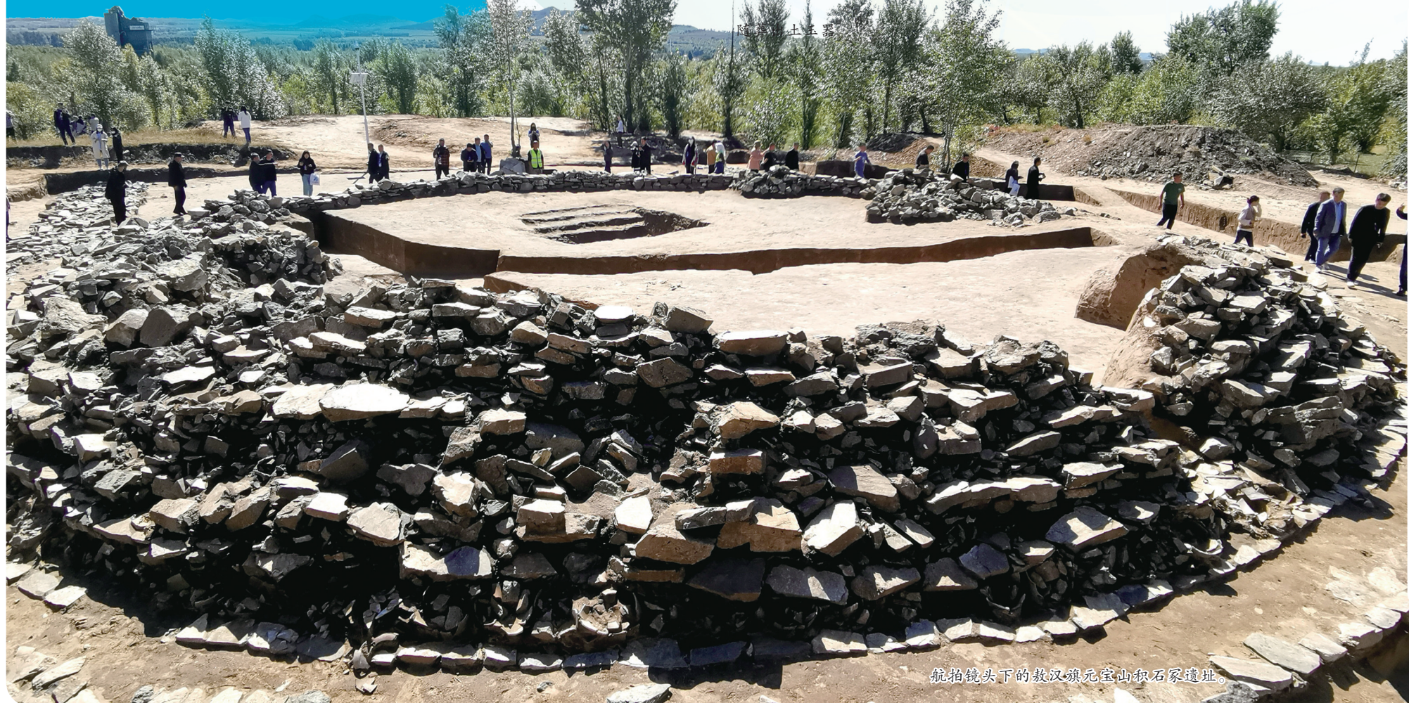
航拍镜头下的敖汉旗元宝山红山石冢遗址。