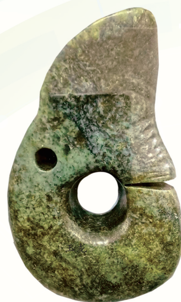
遗址出土的至今体量最大的玉龙。

9月22日，在中华文明的璀璨星辰——“红山文化”命名70周年研讨会上，考古人员向世人揭开了赤峰市敖汉旗元宝山红山石冢的神秘面纱。这是近期由内蒙古自治区文物考古研究院项目团队历时近4个月发掘的最新成果，是内蒙古自治区目前考古发掘最大的红山文化晚期的石冢。红山文化考古再一次“上新”。 红山文化因内蒙古赤峰市红山后遗址的发现、发掘而得名，1954年尹达先生正式提出红山文化的命名。至今已历70年。70年来，用一把手铲叩问文明沃土的考古人，不断解锁着古代文明的密码，追寻着信而有证的中华历史和灿烂文化。红山文化考古的“一次次”上新，确定了红山文化在中华文明起源研究中的源头性地位，为实证中华文明起源不断、多元一体、兼收并蓄的发展脉络及铸牢中华民族共同体意识提供了重要支撑。 此次“上新”的元宝山红山石冢，是内蒙古自治区第一次发现南方北圆、南坛北冢的墓葬兼祭祀为一体的建筑遗存。“礼”就是来源于祭祀。内蒙古自治区文物考古研究院副院长盖之庸说：“元宝山红山石冢兼具合祭的建筑本体，为探讨红山古国文明阶段礼制文明初步形成具有重要意义。” 有学者认为，红山文化以敬天崇祖为基本内涵特征的礼制传统，成为后世中国南北各族居民共同的精神产物和历史文化根源。 “家内大墓出土的玉龙是目前考古发掘出土中体量最大的一件。”内蒙古自治区文物考古研究院研究员盖之庸说。 “龙”，中国人最亲切的身份认同，是红山文化最突出的重要元素之一。被誉为“中华第一龙”的C形碧玉龙、神态飘逸的黄玉龙、体貌如环的玉猪龙，均是人们熟知的红山玉龙形象。2023年8月，在赤峰市松山区彩陶遗址出土了一件龙形蚌饰，是目前红山文化考古发现中出土的唯一一件舒展的龙的形象。 此次“上新”的玉冠饰与凌家滩文化相似，填补了内蒙古自治区红山文化出土玉器考古研究的空白，展现了华东区史前玉器文明的深度交流。 “也再一次印证了史前时期的中华大地，存在远距离的文化交流。”盖之庸说。 满天星斗竞相璀璨的大地，区域间日趋深化的交流与互动为一体化的将来积蓄力量。 原始宇宙观、天文历法、高级物品制作技术、权力表达方式、丧葬和祭祀礼仪等当时最先进的文化粹粹都是交流的内容。龙的构形理念、玉的礼制规范等红山先民最先进的文化粹粹不断在各“国”间传播、交流、互动。 在阿鲁科尔沁旗境内出土的黑彩红陶陶形罐、红色陶体之上，绘制的黑色纹饰，有来自中亚一带的菱形方格纹、黄河流域仰韶文化的玫瑰花纹和红山文化本土的龙纹。 在河南庙底沟遗址曾出土一物纹彩陶罐，纹样风格与仰韶文化彩陶区别明显，有可能是直接由红山文化传入的原创陶器。 在尧都平阳（即陶寺遗址）出土的陶器、彩、彩绘龙纹盘，以及彩绘、绘黑皮陶器都包含了红山文化因素。 考古学家郭大顺先生曾指着红山文化南下和仰韶文化北上交汇示意图说：“红山文化在强势时无阻隔的东北邻区推进少，而以越燕山南下为重点，这是红山先民的历史使命感所为。” 不仅仅是红山先民，所有地区都在不同程度地参与着此后作为整体的华夏文明的构建。经过长时间的积累和传拓，各地区的交流催生了一个在地域和文化上与历史时期中国契合的文化共同体。 河北省文物考古研究院院长张文学说：“文化的交流和传播是非常广泛的领域，红山文化是一个大的区域、大的文化圈，对于红山文化的研究，不仅是内蒙古、辽宁、河北三省区，甚至是与安徽、浙江等地区都应该广泛地开展合作。” “内蒙古对红山文化的考古、研究做了大量工作，在今后的红山文化研究中，将追求精细化、多学科、区域性合作。”盖之庸说。