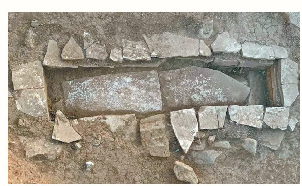
东山头遗址石棺墓。