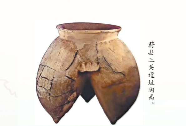
蔚县三关遗址陶器。