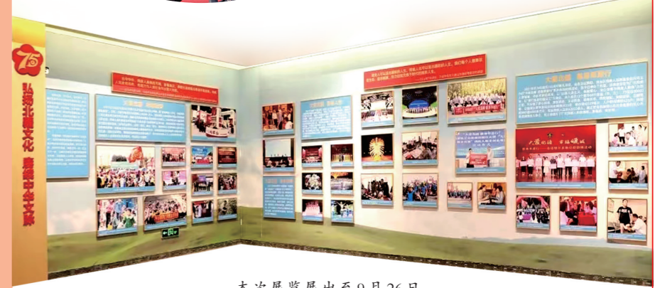
本次展览展出至9月26日。