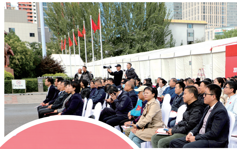
全区近百人参加了启动仪式。