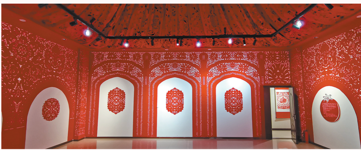
用剪纸装饰的拱门象征事事如意。