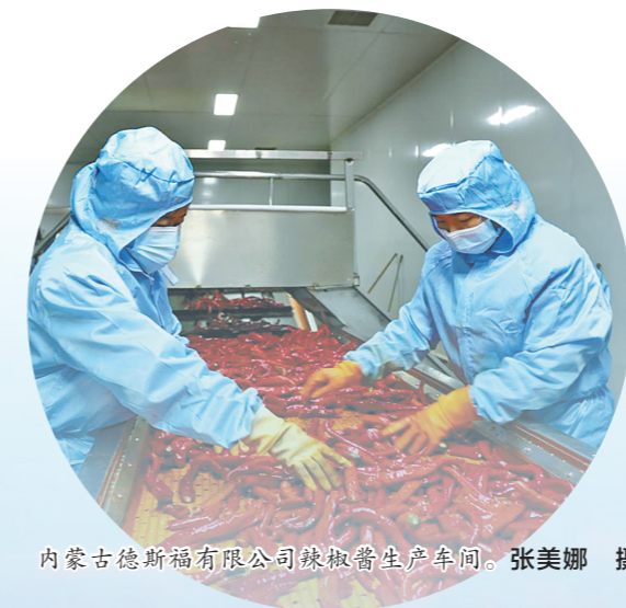
内蒙古德福食品有限公司辣椒酱生产车间。