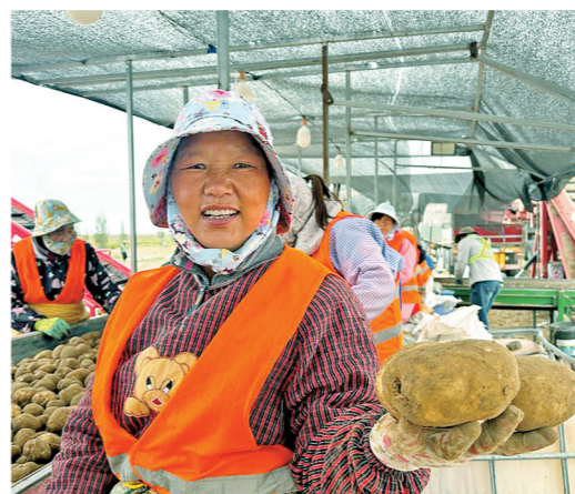
工人正在分拣马铃薯。