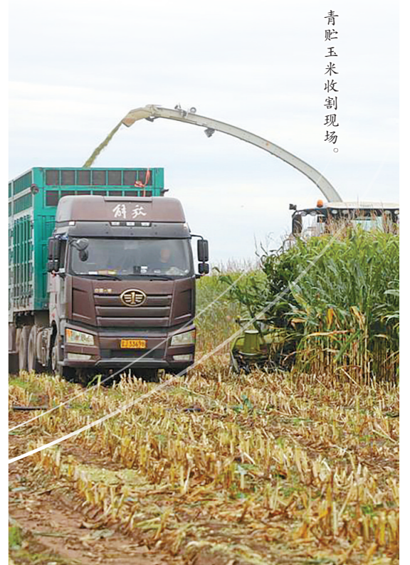
青贮玉米收割现场。