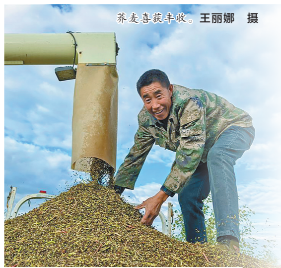
荞麦喜获丰收。

近年来,独贵塔拉镇坚持党建引领,以产业发展为纽带,突出现代农业示范园带动作用,已逐步形成“一村一品”产业格局,持续推动产业发展壮大、提档升级,一个个圆滚滚的马铃薯成为名副其实的“金蛋蛋”,在希望的田野上谱写乡村振兴美好画卷。