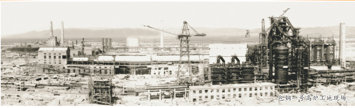
包钢一号高炉工地现场。