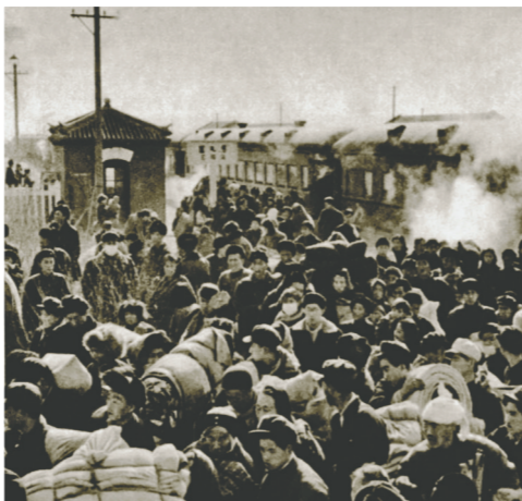
全国各地的建设者支援包钢建设。