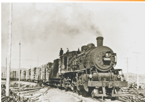
大兴安岭木材运往包钢工地。