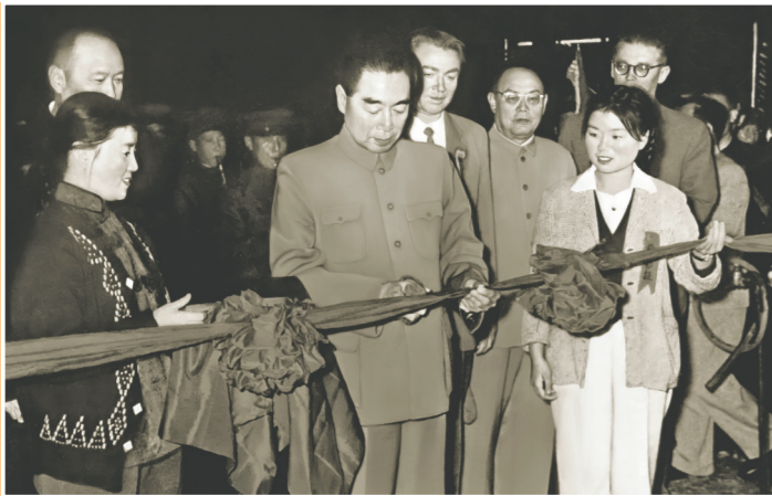
1959年10月15日,中共中央副主席、国务院总理周恩来为包钢一号高炉出铁剪彩。