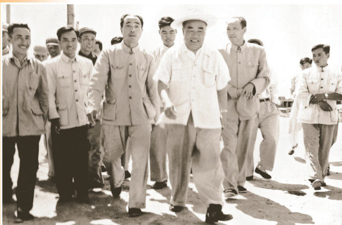
1958年7月19日,中共中央副主席、中华人民共和国副主席朱德视察包钢。