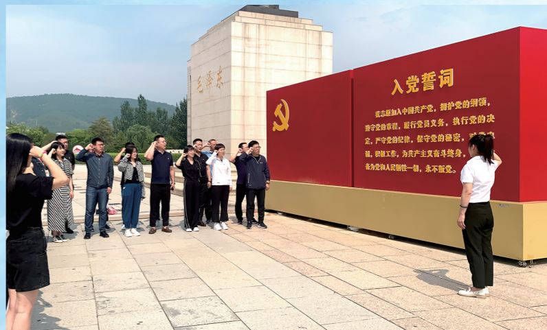
兴安盟第五期年轻干部政治能力提升专题培训班在延安重温入党誓词。