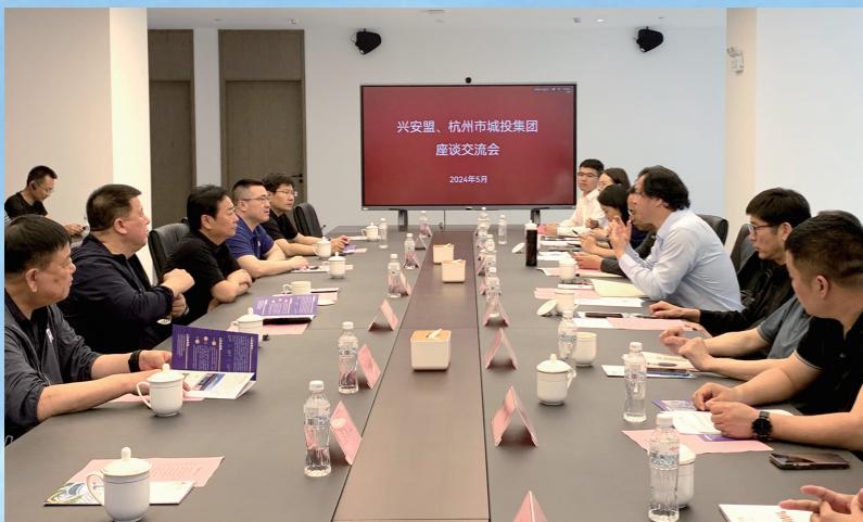
“填补”计划之城市建设管理与基层治理专题培训班赴杭州市城投集团座谈交流。