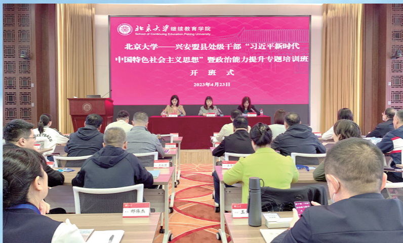
兴安盟县处级干部“习近平新时代中国特色社会主义思想”暨政治能力提升专题培训班在北京大学举办。