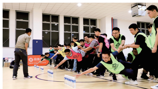
兴安盟第三十九期中青年干部培训团队拓展训练活动。

据了解,兴安盟把党性教育贯穿教学和管理全过程,切实加强年轻学员的党性教育和党性锻炼,确保党性教育课程比重不低于总课时的20%。此外,在开展课堂教学的同时,兴安盟还组织年轻干部赴浙江嘉兴、河南兰考、河南林州、湖南长沙、江西井冈山,踏寻红色足迹,把历史转化为课程,把史料转化为教材,把现场转化为课堂,助力年轻干部接受红船精神、红旗渠精神、井冈山精神洗礼,推进年轻干部筑牢信仰之基、补足精神之钙、把稳思想之舵。同时,先后组织200余名年轻干部赴先进地区学习经验,让年轻干部走进发展一线感悟思想伟力、汲取发展动力。