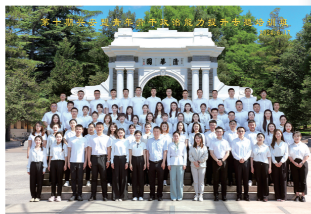
第十期兴安盟青年骨干政治能力提升专题培训班在清华大学开班。