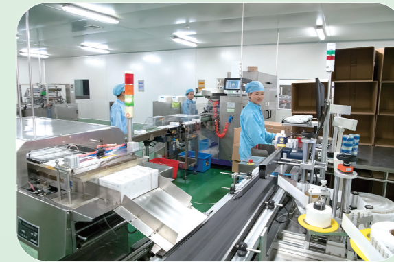
内蒙古蒙药股份有限公司现代化蒙药包装车间。