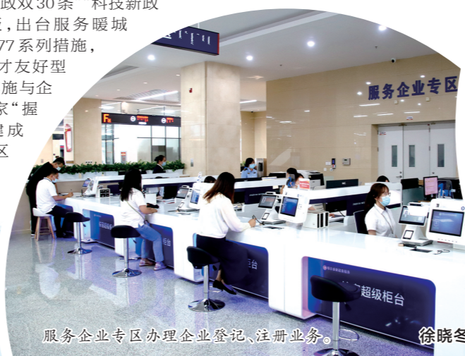
服务企业专区办理企业登记、注册业务。