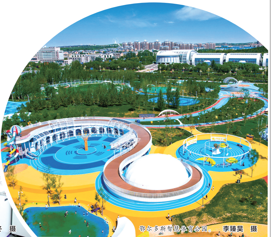
鄂尔多斯智慧体育公园。