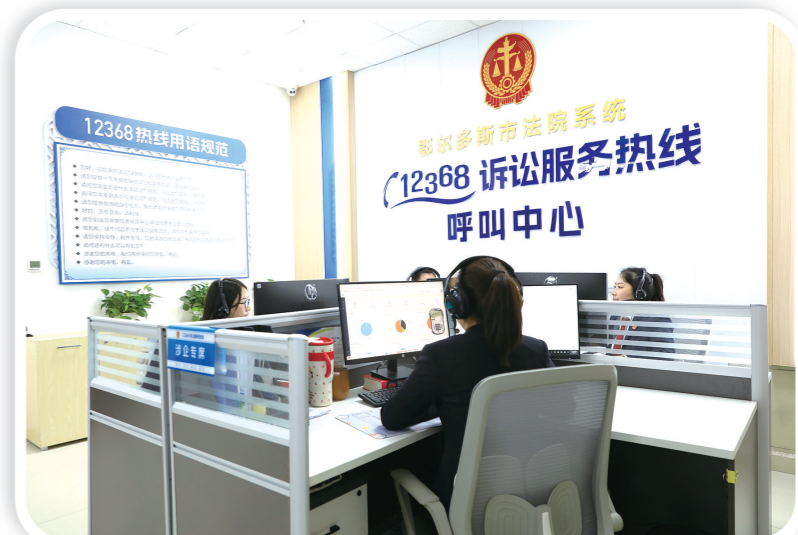
打造自治区首家12368诉讼服务热线集约运行模式,月平均在线1900小时,群众满意率100%。

一委员”,设置政企会客厅,常态化开展“政企恳谈会”“我陪群众走流程”等活动,“多角度、零距离”倾听企业家声音,“面对面、肩并肩”解决企业诉求。健全完善市、旗(区)、苏木(乡镇)“三级助企”工作机制,实行“一名领导牵头、一个部门负责、一个服务专班跟进、一套工作计划保障”,以全周期、全链条、全要素的服务,助力经营主体高质量发展。