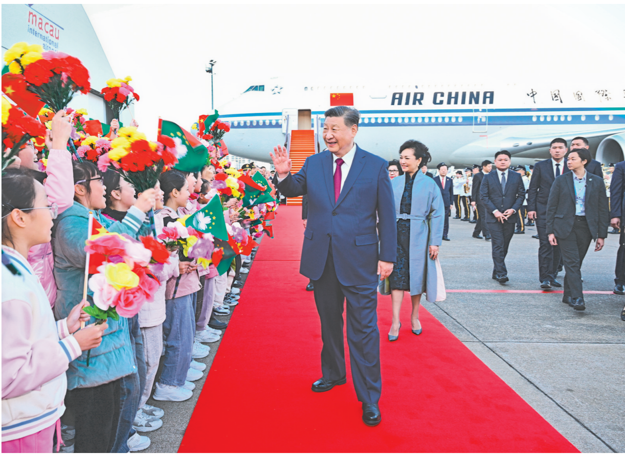
12月18日下午,中共中央总书记、国家主席、中央军委主席习近平乘专机抵达澳门,出席将于20日举行的庆祝澳门回归祖国25周年大会暨澳门特别行政区第六届政府就职典礼并视察澳门。这是习近平和夫人彭丽媛向欢迎人群致意。

新华社澳门12月18日电 中共中央总书记、国家主席、中央军委主席习近平18日下午乘专机抵达澳门,出席将于20日举行的庆祝澳门回归祖国25周年大会暨澳门特别行政区第六届政府就职典礼并视察澳门。 16时许,习近平乘坐的专机徐徐降落在澳门国际机场。习近平和夫人彭丽媛走出舱门,向欢迎人群挥手致意。澳门警察乐队奏响热情洋溢的欢迎曲,舞龙舞狮表演喜气欢腾。舷梯旁,两名少年儿童向习近平和彭丽媛献上鲜花。在澳门特别行政区行政长官贺一诚和夫人郑素贞陪同下,习近平和彭丽媛同前来迎接的人员亲切握