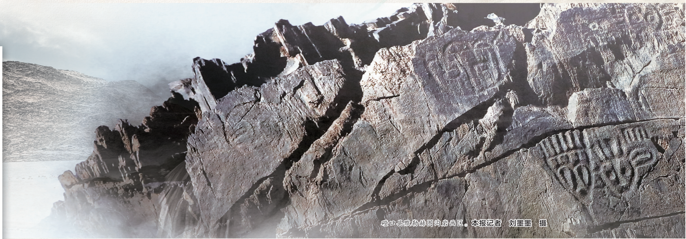
磴口县墩磨沟岩画区。

时光在岩石上沉淀,留下永恒之思、超越之想。当我们置身画语意境,再次凝望阴山岩画时,依旧可以感受到来自遥远时代的心灵感悟,赞叹这想象瑰丽、意境深远的壮阔史诗。