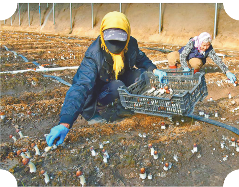
工人们采摘赤松茸。