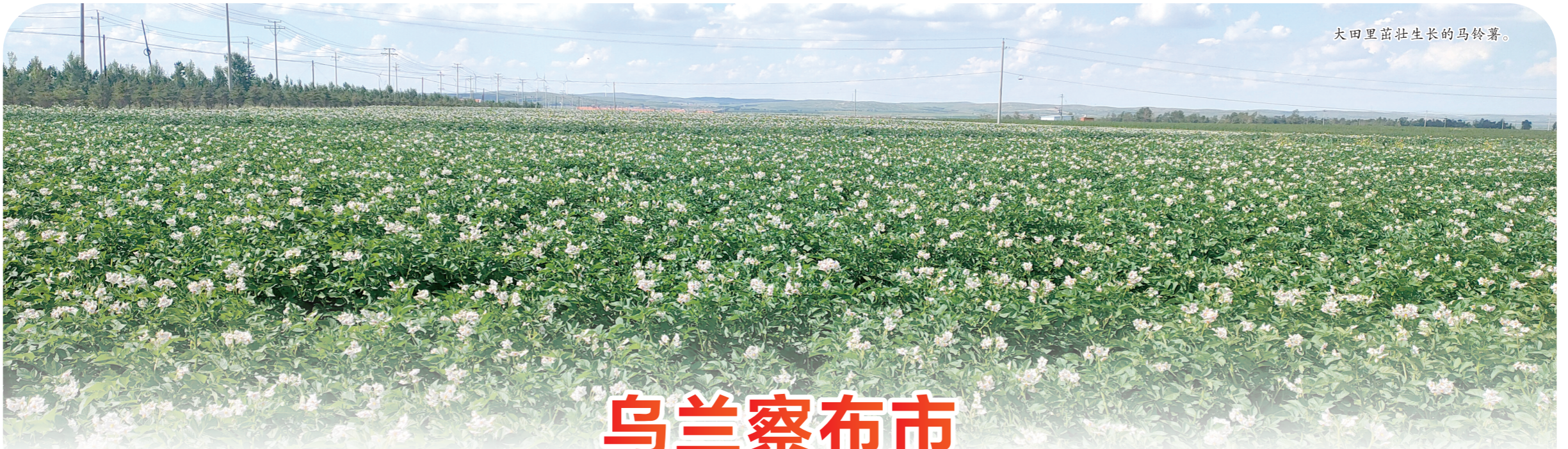
大田里茁壮生长的马铃薯。