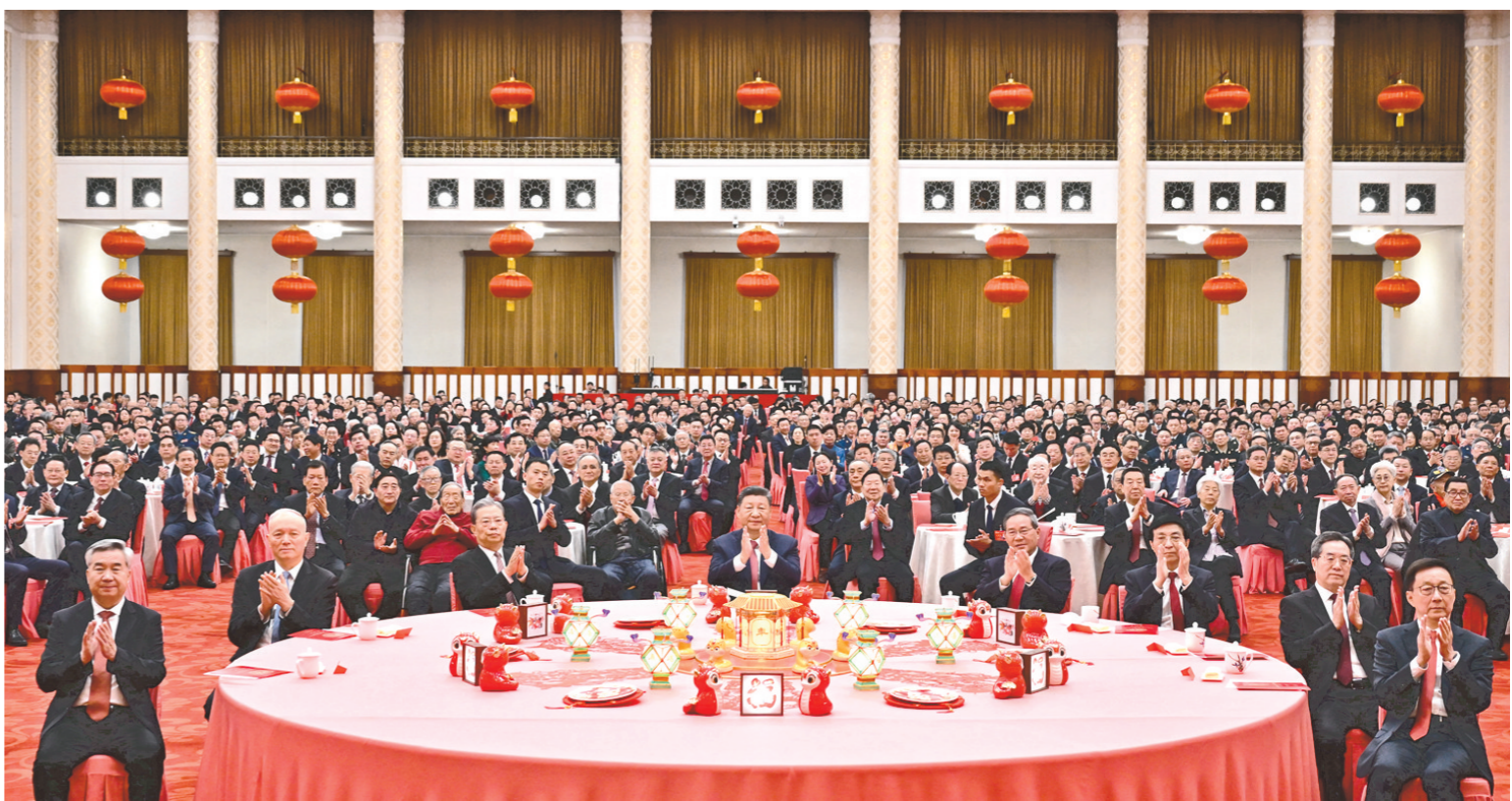
1月27日，中共中央、国务院在北京人民大会堂举行2025年春节团拜会。党和国家领导人习近平、李强、赵乐际、王沪宁、蔡奇、丁薛祥、李希、韩正等同首都各界人士欢聚一堂、共迎佳节。